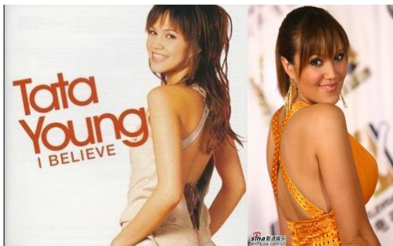
Figura 2: Tata Young na capa de seu Álbum “I Believe” em 2004 e em 2008.