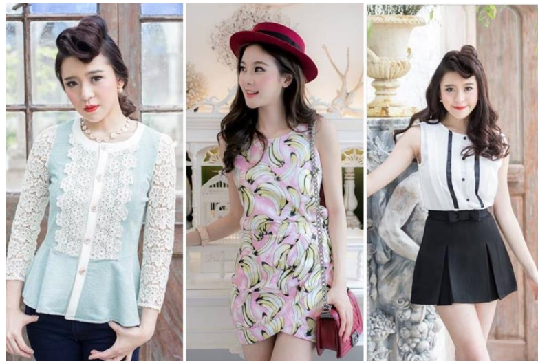
Figura 6: Moda Tailandesa (2014)