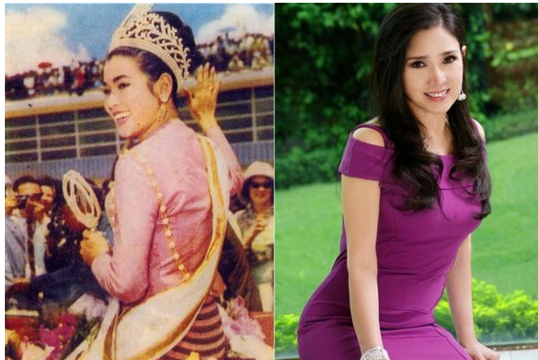
Figura 3: Apasra Hongsakula em 1965 (18anos) e em 2014 (67 anos).

Recentemente surgiu nas redes sociais e portais de notícias uma foto atual da ex-Miss Universo da Tailândia, do ano de 1965, Apasra Hongsakula foi a primeira Miss Universo tailandesa. Apasra tinha apenas 18 anos quando ganhou a coroa de Miss. Hoje, com 67 anos de idade, a tailandesa intrigou a mídia com uma foto que circula pela internet. Apasra está tão jovial como em 1965. Estimasse que a ex-Miss tenha gasto dois milhões de dólares em cirurgias plásticas.