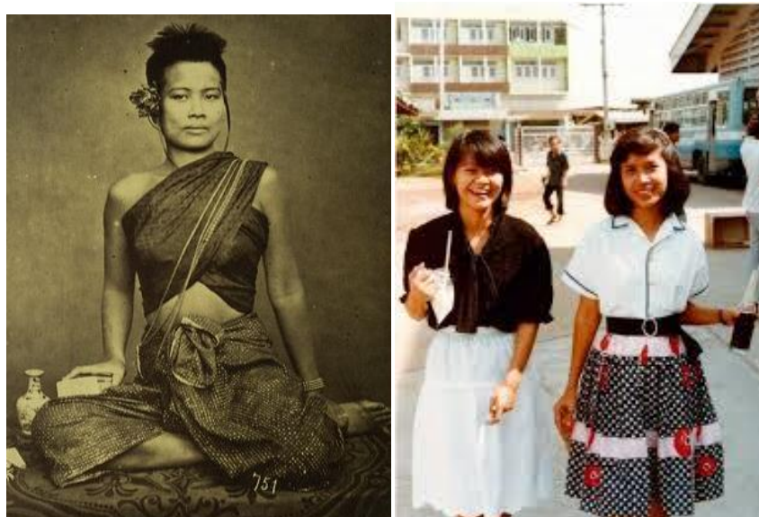
Figura 4: Tailandesa da década de 1940 e Tailandesas da década de 1980.

Os produtos com agentes clareadores fazem um sucesso imenso na Tailândia e em outros países asiáticos. A mulher tailandesa é extremamente preocupada em ter a pele branca e bem cuidada. Podemos notar (Figuras 4, 5 e 6) como a pele e os trajes das mulheres tailandesas ficaram mais ocidentais com o tempo: