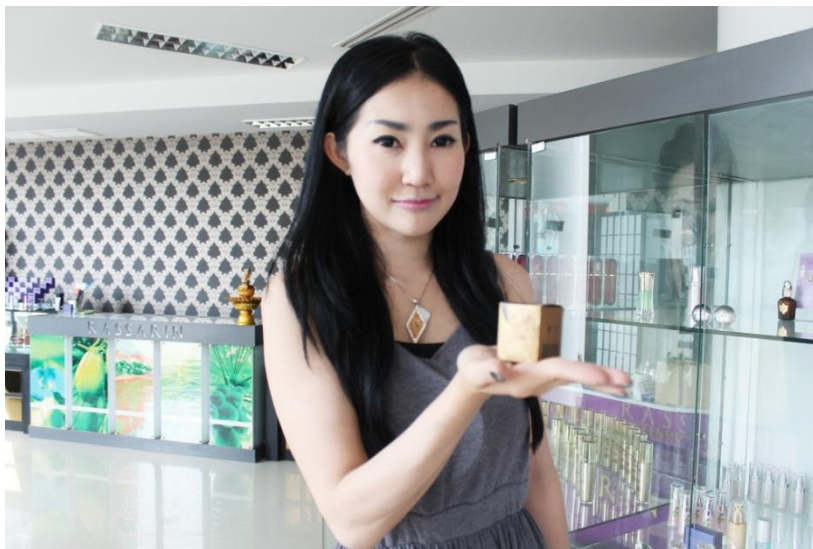
Figura 1: Thailand's whitening creams: Comfortable in your own skin?