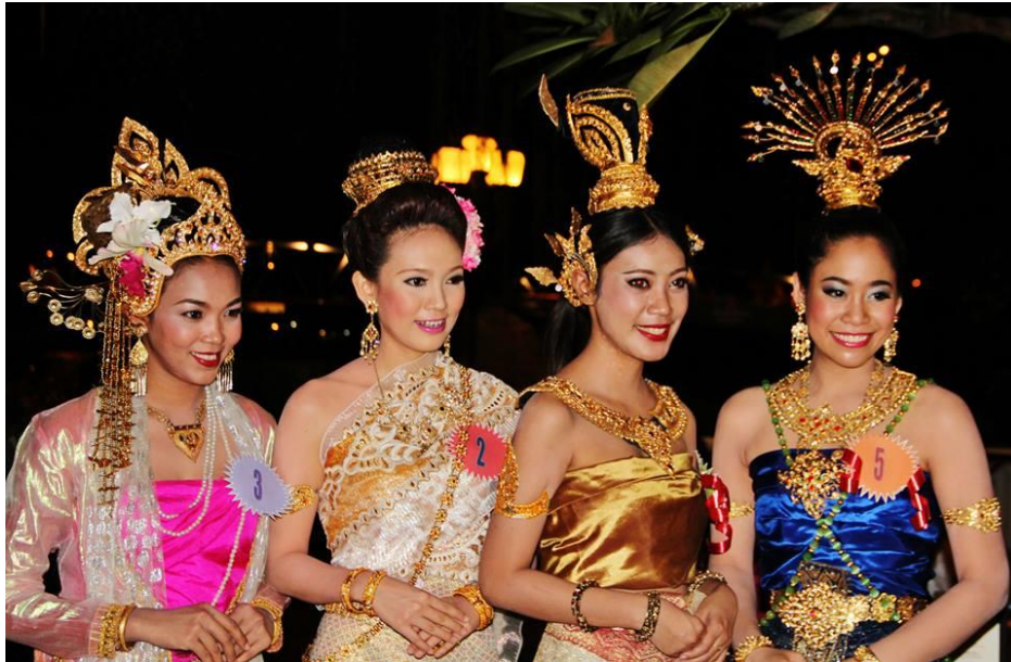
Figura 5: Tailandesas com traje tradicional tailandês (2014)