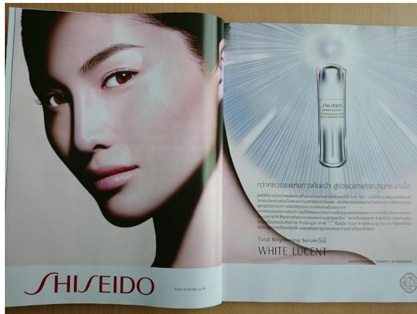
Figura 7: Anúncio de cosmético de beleza para o rosto da marca japonesa Shiseido com o rótulo de Total Brightening Serum , agente clareador (2014).

Na revista Elle da Tailândia, os anúncios de publicidade de cosméticos de beleza são todos com agentes clareadores. As mulheres tailandesas só compram os cosméticos de beleza quando se trata de clareamento para a pele (produtos que tenham “white” no rótulo). O que realmente importa em primeiro lugar é ter uma pele clara e bem cuidada. A maquiagem passa a vir em segundo plano.