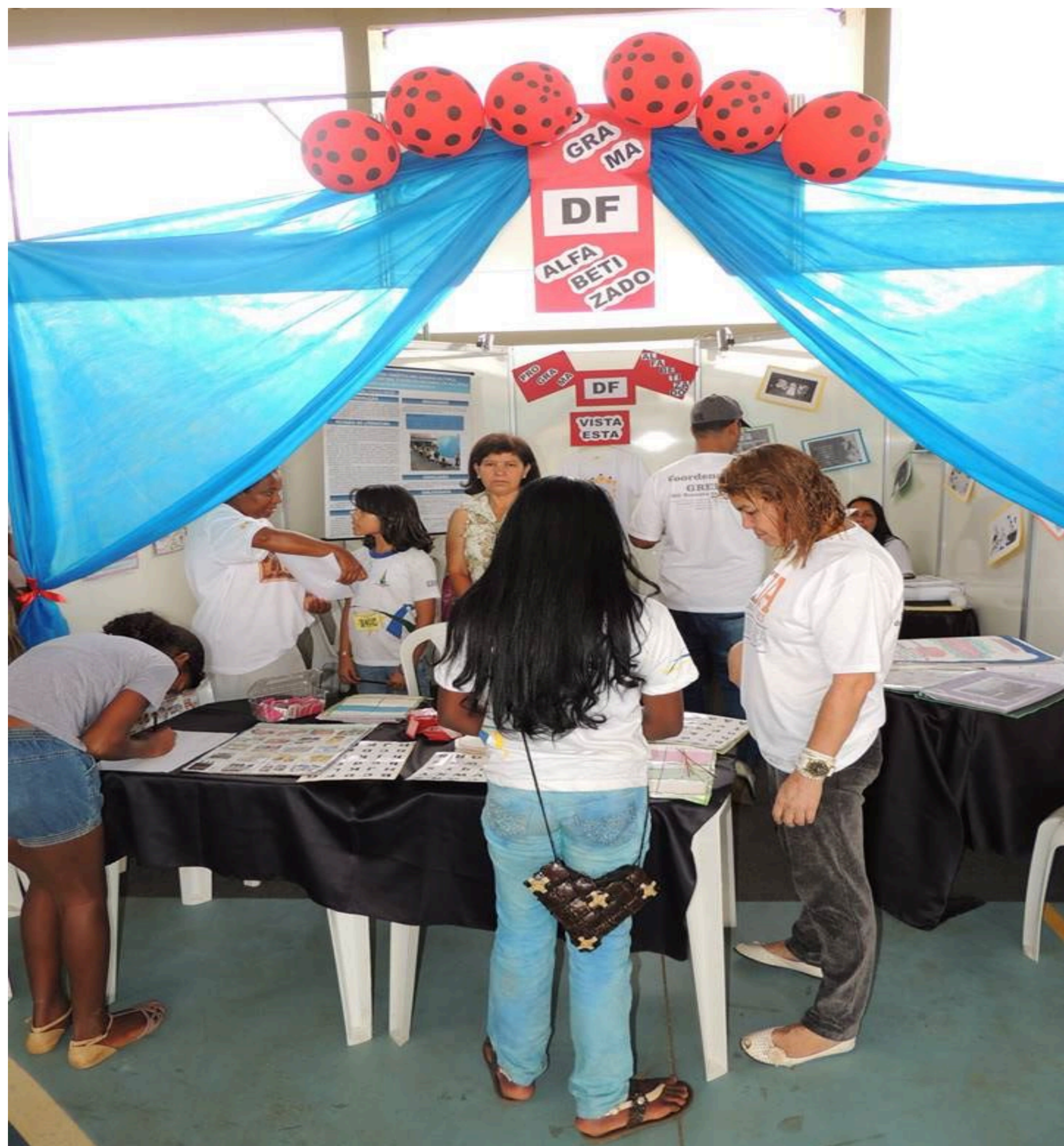
Figura 1 – Feira de Ciências 2013.

A principal teoria será da construção coletiva do conhecimento, com métodos que levem o educando a se tornar protagonista de suas ações, numa proposta de trabalhar os conteúdos básicos oriundos da educação interdimensional - racionalidade, corporeidade, afetividade e espiritualidade.