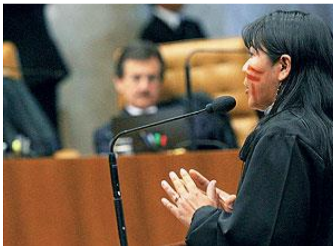
Figura 2: Joênia Wapixana, advogada indígena, em sessão do STF de 2008 que julgou o processo demarcatório da Terra Indígena Raposa Serra do Sol