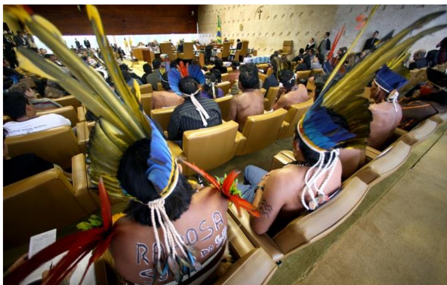
Figura 3: No STF, em 2009, indígenas acompanham o julgamento do processo demarcatório. Foto: Nelson Júnior/STF

Fonte: Instituto Socioambiental - ISA 12