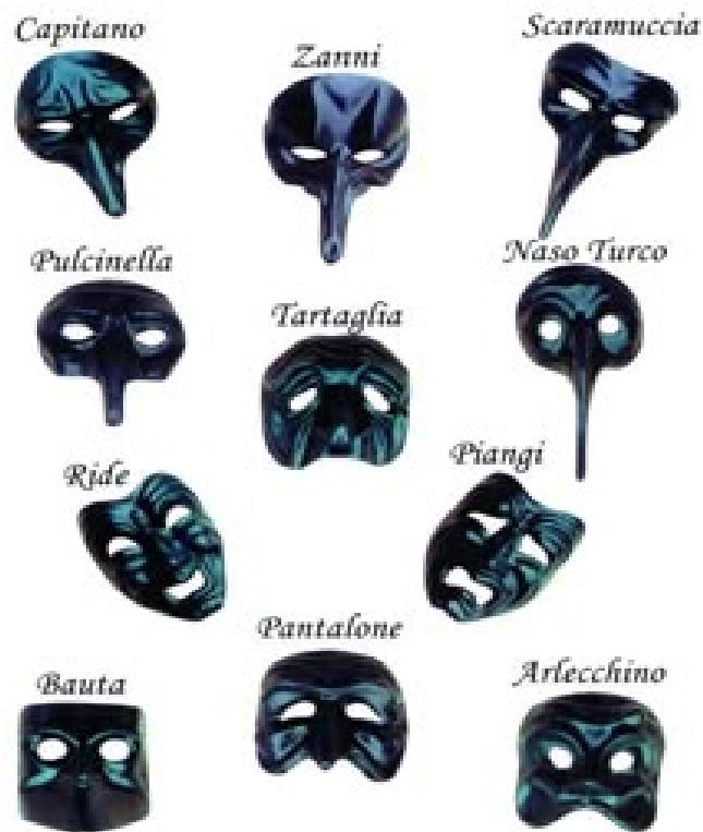
10. Exemplos de máscaras e tipos da Commedia Dell'Arte

Máscaras e maquiagem possuem a função de aproximar público e artistas e chamar a atenção para o que está sendo apresentado e performado, proporcionando uma maior visibilidade para a ação teatral ali desenvolvida. Seja na forma de uma expressão estática e fixa, que é o que a máscara tradicional e sólida proporciona, seja na forma de pintura que se estende do rosto ao corpo, destacando, ocultando, ampliando, contrastando plurais elementos do próprio corpo do intérprete.