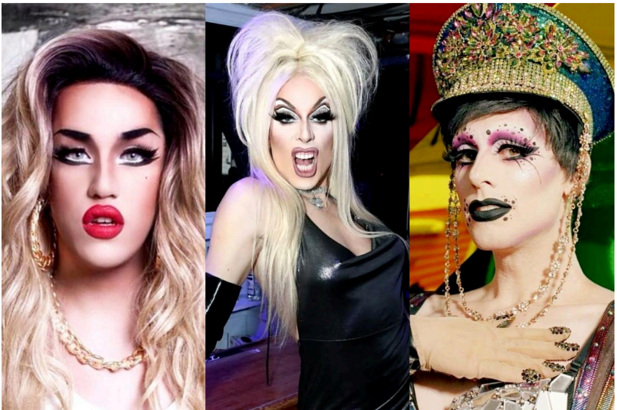
13. Adore Delano, Alaska Thunderfuck e Dusty Ray-Bottoms respectivamente. Todas ex participantes e competidoras do reality show Rupaul's Drag Race

Quando descobri o programa Rupaul's Drag Race , como citei na introdução, entendi e aprendi muito sobre a arte de fazer drag, e por diversos momentos eu fui cativado por alguma drag participante do programa seja por sua performance, atitude, personalidade, figurinos que me agradavam, cabelos e maquiagem que me chamavam os olhos e então fui registrando esses elementos, acumulando repertórios para que, aos poucos, eu pudesse construir a minha própria personalidade drag. Após acompanhar as 6 temporadas até então existentes do reality de RuPaul, algumas destas drag queens, como Adore Delano, Alaska Thunderfuck e, algum tempo depois, Dusty Ray Bottoms, se tornaram grandes referências visuais, de estéticas e estilos que me agradavam o suficiente para querer usar de inspiração para dar vida à minha própria drag não muito tempo depois.