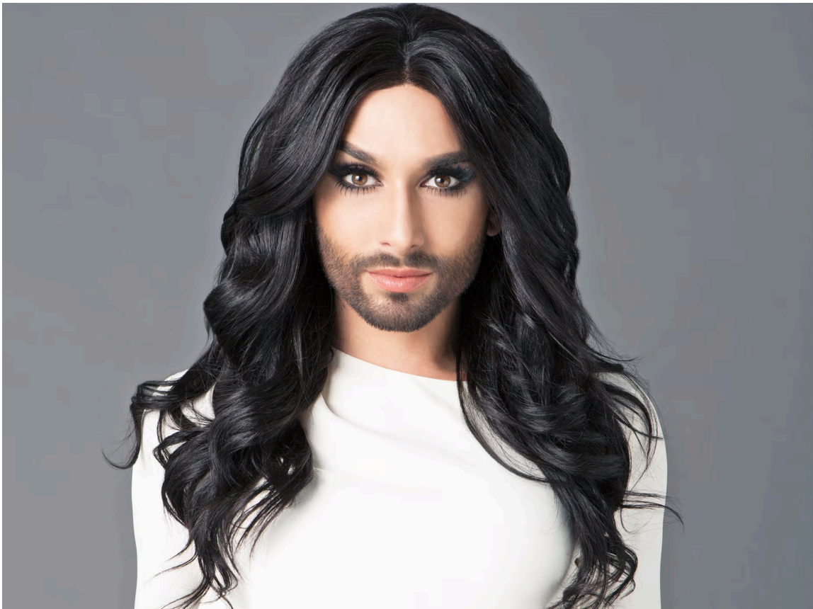
12. Conchita Wurst

Uma das minhas maiores influências drag que descobri antes mesmo de conhecer o programa Rupaul's Drag Race , foi Conchita Wurst. Conchita é uma drag queen e cantora austríaca, que no ano de 2014 ganhou bastante notoriedade na mídia por ter sido a vencedora do Festival Eurovisão da Canção, famoso concurso musical europeu. Conchita, além de sua voz potente e encantadora, me chamou a atenção por estar nos holofotes sendo uma drag queen barbada. Acredito que até aquele momento, eu nunca tinha visto uma drag queen com barba antes, e aquilo me atravessou e me cativou de forma a despertar um interesse antes adormecido.