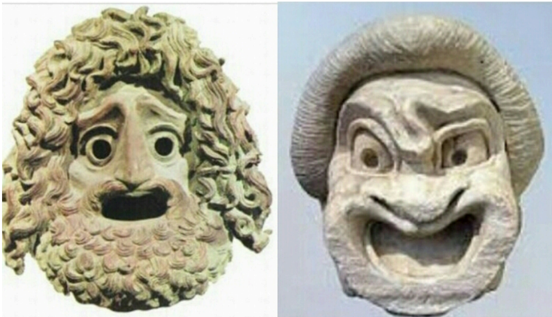
9. Máscaras gregas

Buscando outros conceitos para a palavra, o Dicionário Michaelis de Língua Portuguesa, define a palavra persona como: “Imagem apresentada por uma pessoa em público; maneira pela qual um indivíduo se comporta na companhia de outras pessoas, projetando uma imagem às vezes diferente de sua verdadeira