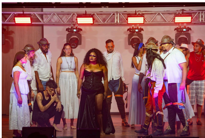
Figura 11. Sabugo de Palco 2025. Aruna e o Aboio Encantado .