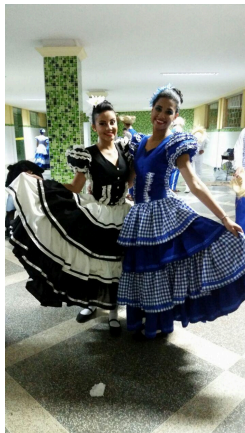
Figura 4. Primeiro traje da Sabugo de Milho, em 2015