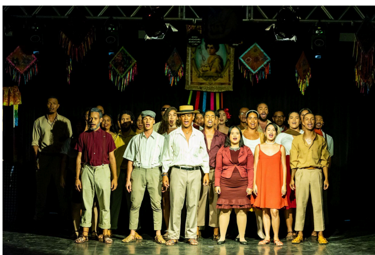
Figura 10. Sabugo de Palco 2024. O Amor é Filme .

Por fim, apesar de no Nordeste existir essa lapidação maior do que seria uma apresentação teatral no arraiaá, com a presença inclusive do texto falado, sinto que a provocação que o teatro no Centro-Oeste promove em relação ao movimento junino se difere dessa perspectiva nordestina, por ser um teatro que busca falar mais corporalmente e coletivamente dentro da construção do brincante/intérprete. Sendo assim, concluo este capítulo compreendendo que o teatro é um caminho de desenvolvimento para o movimento junino.