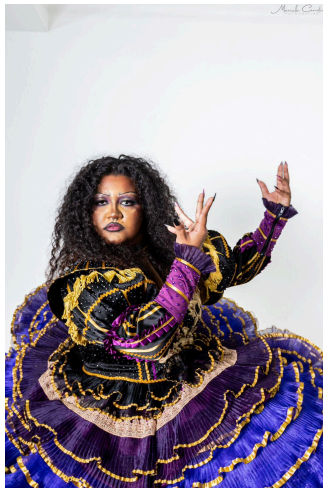
Figura 3. Personagem Lúcia Calamidade