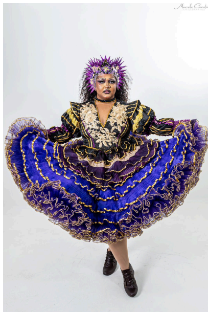
Figura 8. Primeiro traje desenhado por Diogo Soares