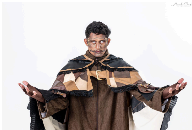
Figura 2. Marcador Xandão, da Quadrilha Sabugo de Milho

contador de toda a história, normalmente como um personagem presente dentro da trama e condutor da banda ou sonoplastia.