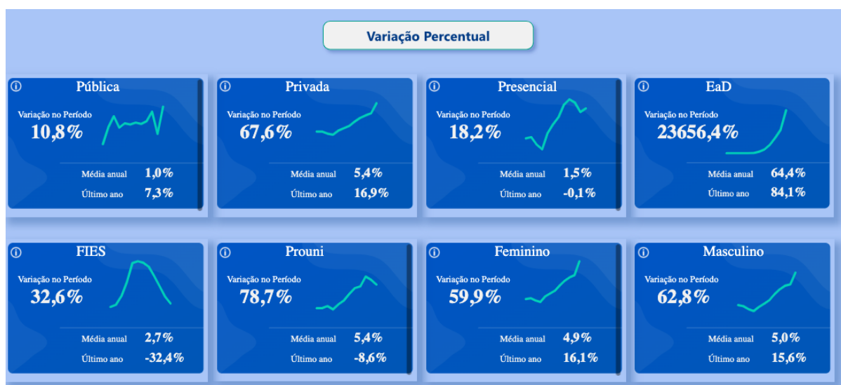
Figura 2: Variação percentual sobre os cursos de enfermagem no Brasil, comparando pública x privada, presencial x EAD, FIES x PROUNI, público feminino x masculino. Comparativos do ano de 2021.