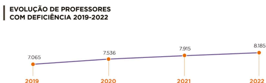
Gráfico 1 - Evolução de Professores com Deficiência: Brasil 2019 a 2022

De acordo com o Instituto Rodrigo Mendes (IRM), em 2022, o número de professores regentes no país era de 2.315.616 na educação básica, sendo que apenas 8.185(0,35%) têm uma deficiência. Nos anos anteriores, foram registrados números ainda menores, como no ano de 2019, onde esse número era de 7.065(0,31%) professores.