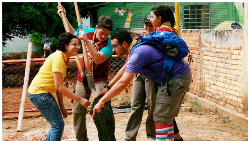
Imagem 5: Reforma de uma escola na Estrutural