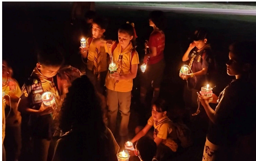
Imagem 13: Cerimônia espiritual realizada pelos lobinhos do Grupo Escoteiro José de Anchieta

Essas atividades desempenham um papel fundamental na formação integral dos participantes, incentivando reflexões profundas e o desenvolvimento de valores que transcendam o mundo material. Além disso, contribuem para a construção da cidadania planetária ao estimular uma maior sensibilidade, harmonia e respeito em relação à natureza, às diversas culturas e à interconexão entre todos os seres vivos.