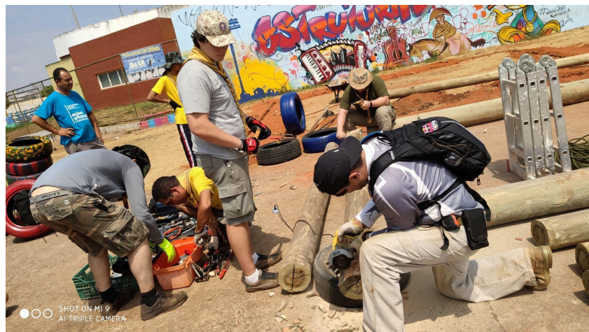
Imagem 4: Reforma de uma escola na Estrutural