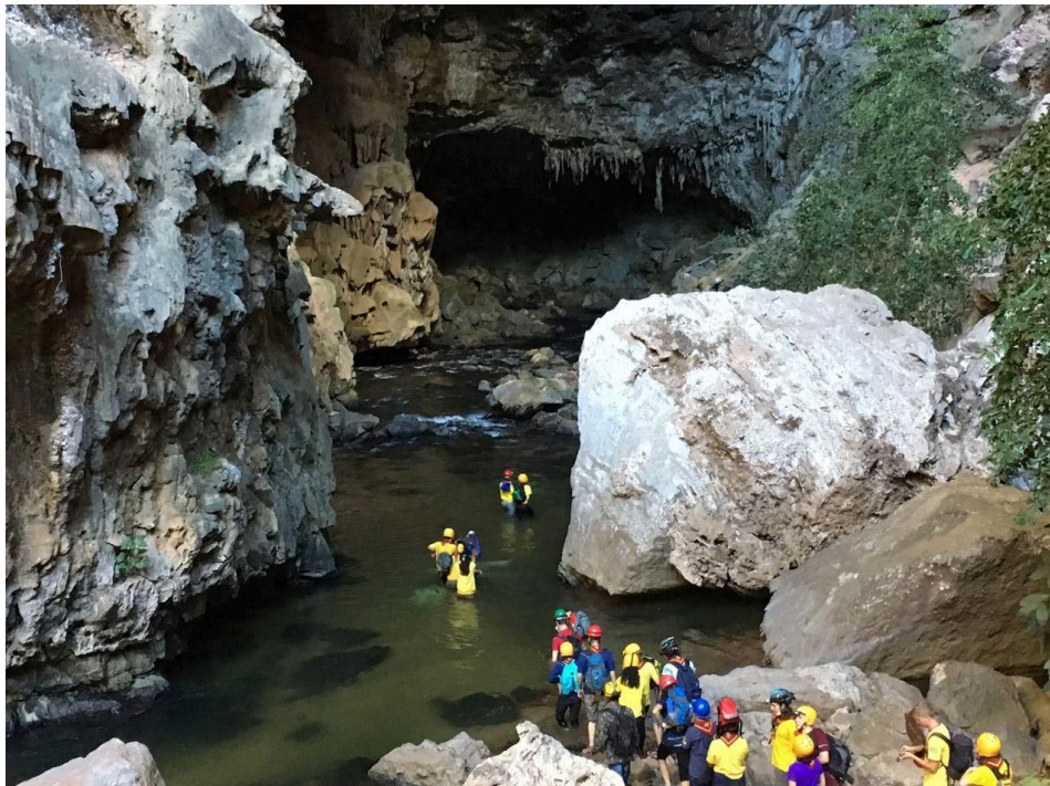
Imagem 7: Trilha pela caverna em Terra Ronca-GO