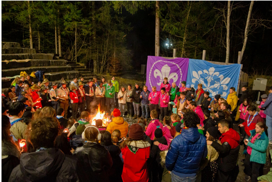
Imagem 14: Cerimônia espiritual de encerramento do Fogo de Conselho no Centro Escoteiro Internacional de Kandersteg - Suíça.