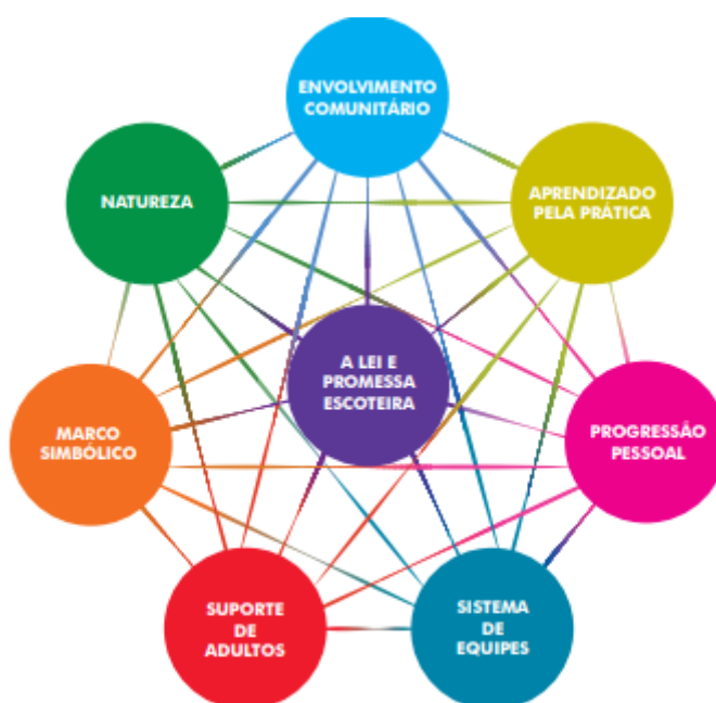
Imagem 1: Esquema do Método Educativo Escoteiro