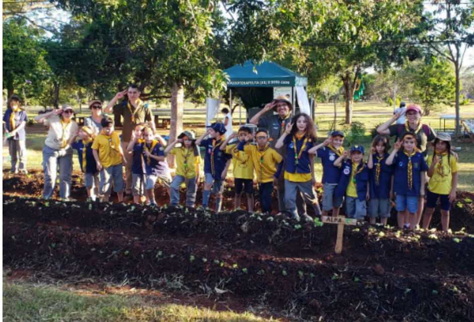
Imagem 6: Criação de uma horta