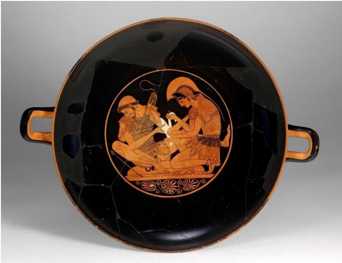
Fonte: SOSÍAS, Aquiles tratando das feridas de Pátroclo, cálice ático, 500 a.C. Disponível em: https://www.smb.museum/en/museums-institutions/alters-museum/collection-research/collection-highlights/ . Acesso em: 01/06/2025.

O vaso é um cálice ático intitulada Aquiles tratando as feridas de Pátroclo e data aproximadamente de 500 a.C. Atualmente, ele se encontra no Kunsthistorisches Museum em Berlim. A cena retrata Aquiles tratando os ferimentos de Pátroclo, que vira a cabeça e tem uma expressão de dor. Enquanto Aquiles cuidadosamente enfaixa seu braço, observa-se que ambos portam suas armaduras de guerra. No entanto, a cena não é narrada na Iliada , embora não seja improvável imaginar algo parecido na poesia de Homero, visto que o relacionamento dos dois se baseava no companheirismo e cuidados mútuos. Outro ponto abordado por Lightner (2024, p. 34) são as relações pederásticas na Grécia Antiga, nas quais jovens do sexo masculino mantinham um relacionamento sexual e romântico com homens mais velhos. Aqui, a relação era de mentor-pupilo. O mentor era denominado erastes (“amante”) e o pupilo era o eromenos (“amado”), um jovem que deveria ter mais de 12 anos e menos de 18 (CORINO, 2006, p. 22). A relação iniciava-se com um cortejo e o adolescente avaliava se o erastes seria um mentor digno, pois o parceiro em potencial deveria oferecer educação aristocrática e social, além de uma rede social e política ampliada e acesso a círculos de classes mais altas.