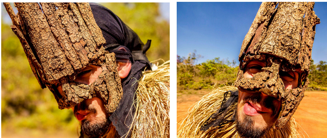
Imagem 12 e 13: Registro do rosto da Senhora Seca na Trilha das Copaíbas, no dia 18/08/24, em Brasília, DF.

A máscara da Senhora Seca foi produzida a partir do molde do meu rosto com uma abertura lateral direita na região da boca, utilizando como material a gaze gessada. Pinte o molde com tinta acrílica em mistura de tons de marrom e após seco coleí diversas cascas de árvores que selecionei. Ao final, amarrei o elástico e já estava pronta para as experimentações.