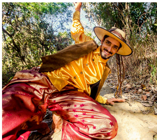
Imagem 8 e 9: Registro de ensaio e brincadeira com figurino mais atualizado do Encanto que incorpora as ideias citadas no capítulo 2, na Trilha das Copaibas, em Brasília, DF, no dia 18/08/24.

A criação do Encanto é um sonho realizado e um trabalho de aprofundamento para toda a vida. Agora vamos ver o processo de criação da figura Senhora Seca.