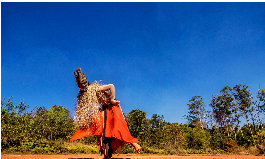
Imagem 16: Registro da figura Senhora Seca na Trilha das Copaibas, em Brasília, DF, no dia 18/08/24, em Brasília, DF. Fonte: Adele de Fé - @caminhantecaminha - Acervo pessoal Ale Barata.

Imagem 15: Registro de ensaio e brincadeira com figurino mais atualizado da Senhora Seca que incorpora as ideias e corporalidades citadas no capítulo 3, na Trilha das Copaibas, no dia 18/08/24, em Brasília, DF. Fonte: Adele de Fé - @caminhantecaminha - Acervo pessoal Ale Barata.