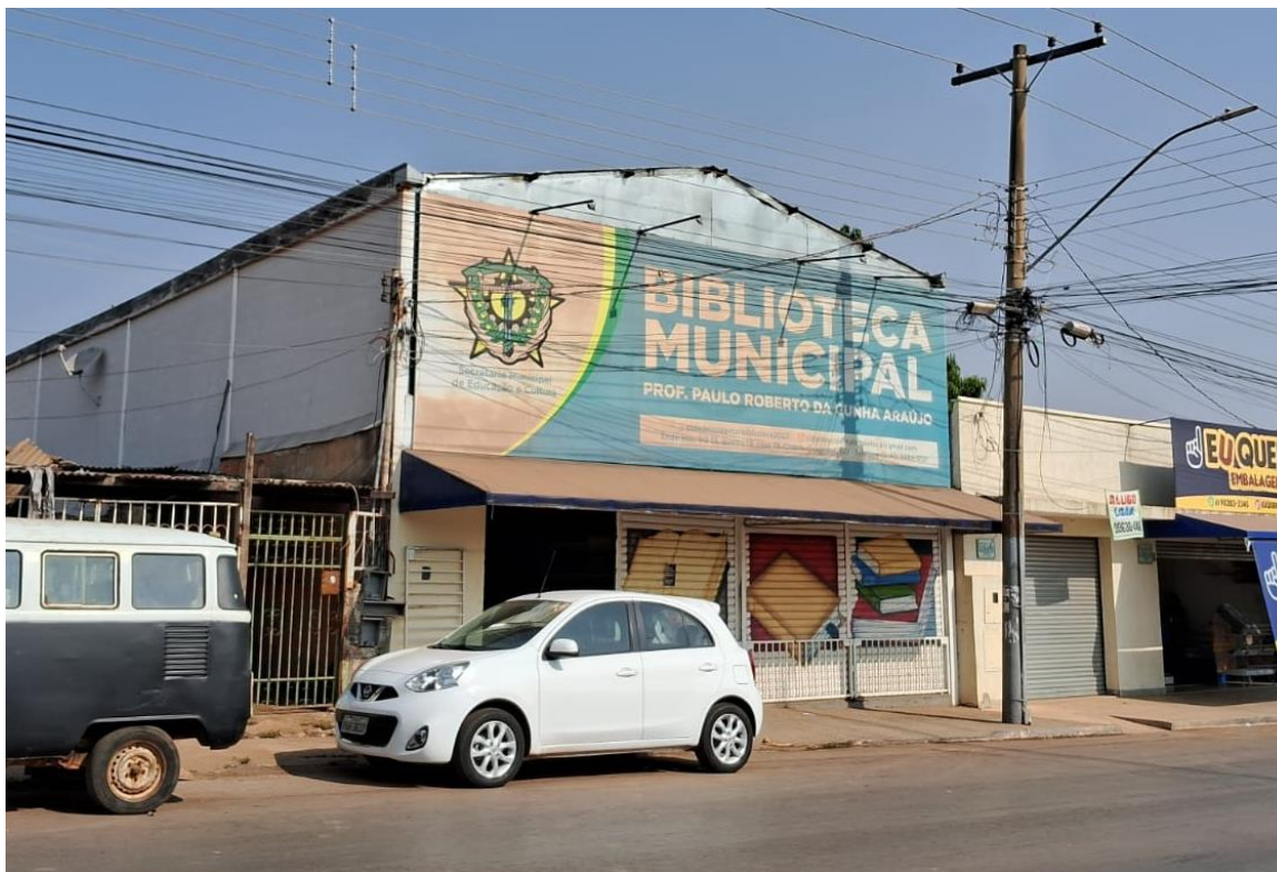
Figura 3 - Fachada da Biblioteca