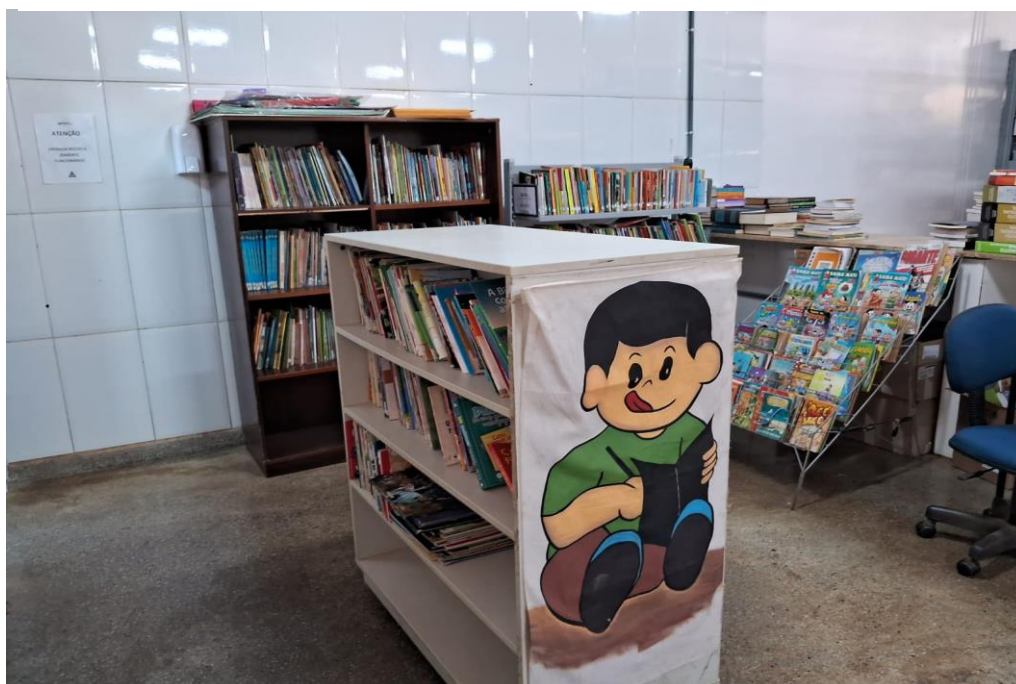
Figura 7 - Seção Infantil