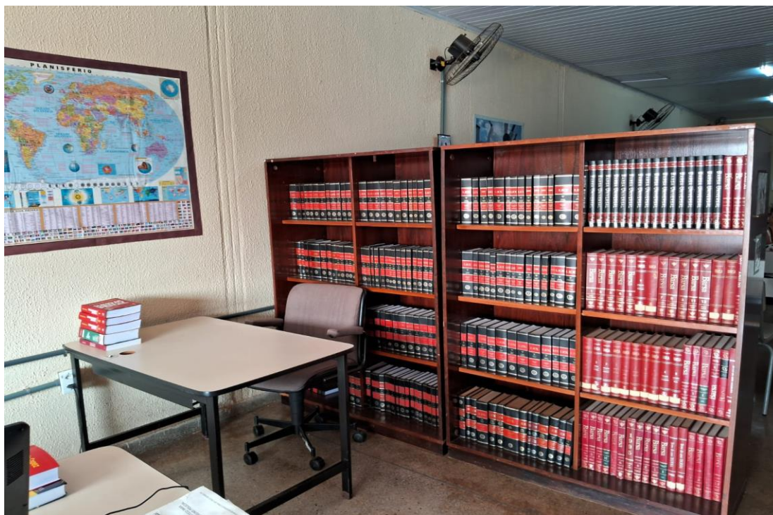
Figura 6 - Interior da Biblioteca II