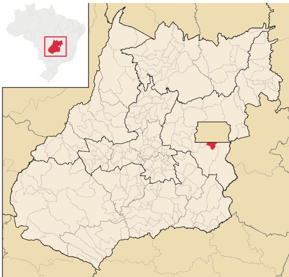
Figura 1 - Localização da Cidade Ocidental - GO

A Cidade Ocidental faz parte da a Região Integrada de Desenvolvimento do Distrito Federal e Entorno (RIDE/DF) e sua população o foi estimada em 91.767 habitantes pelo censo do IBGE de 2022. A Figura 1 retrata a sua localização geográfica.