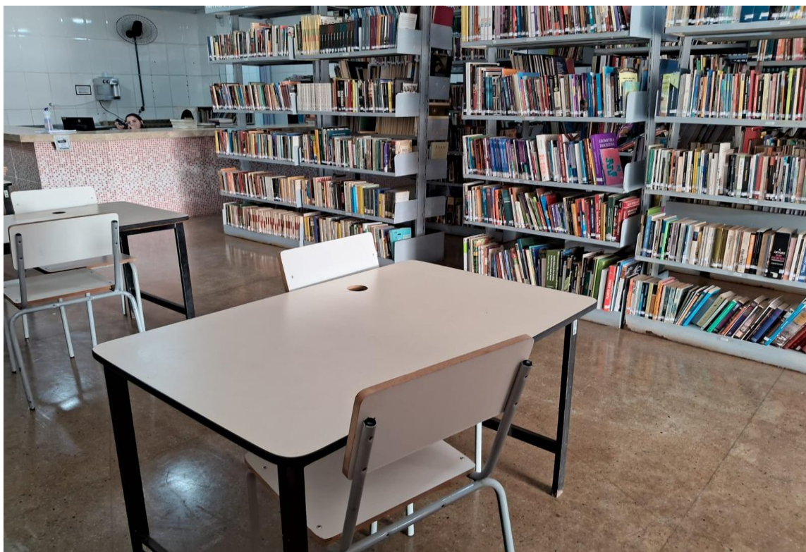
Figura 5 - Interior da Biblioteca