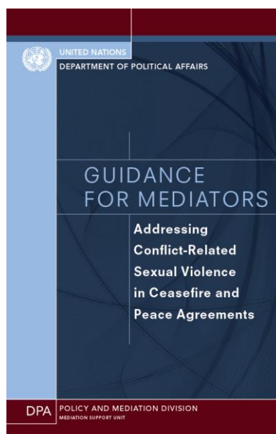
Figura 2 - Contra-capa