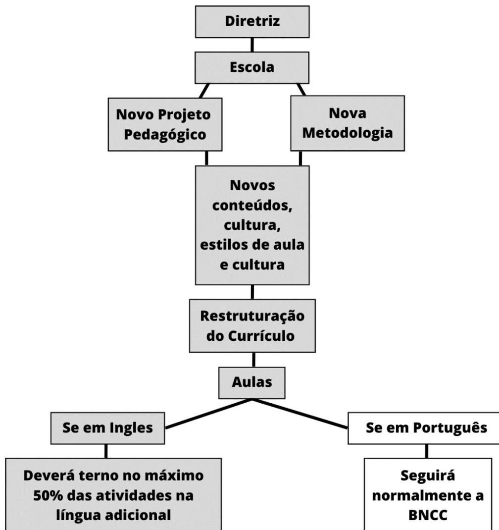
Tabela 1. Organograma das mudanças provocada pelo projeto de resolução do ensino bilingue no Brasil e as influências nas escolas.

O organograma acima tem como objetivo facilitar a visualização de algumas das mudanças provocadas pela diretriz de ensino bilingue no Brasil. Conseguimos observar que as mudanças ficaram em caráter de Projeto pedagógico novo, metodologia nova onde a escola tem a opção de escolher o modelo e ou de onde ela irá seguir, como consequência disso serão apresentados novos conteúdos, aulas com estilos diferentes e a cultura do país ou região a qual escolheu, essa reestruturação do currículo trará consigo as aulas em inglês e também reestruturação das aulas. Na Tabela 1. é notado que está faltando algumas características da