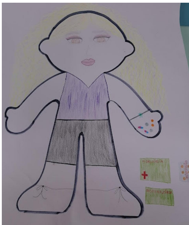
Figura 2 (Adolescente 12)- Ilustração criada pela participante acerca das medicações utilizadas.

Ruim, porque não podia comer se tomasse ele, eu tinha que esperar 30 minutos (Criança 5).