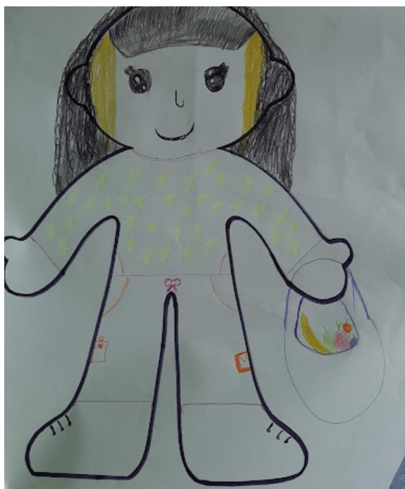
Figura 1 (Adolescente 11) - A participante retrata métodos utilizados para a promoção do autocuidado, com imagem de alimentos saudáveis (frutas e verduras) em uma bolsa.

Eu faço tudo bem.. [Referindo-se ao tratamento]. (Adolescente 11).