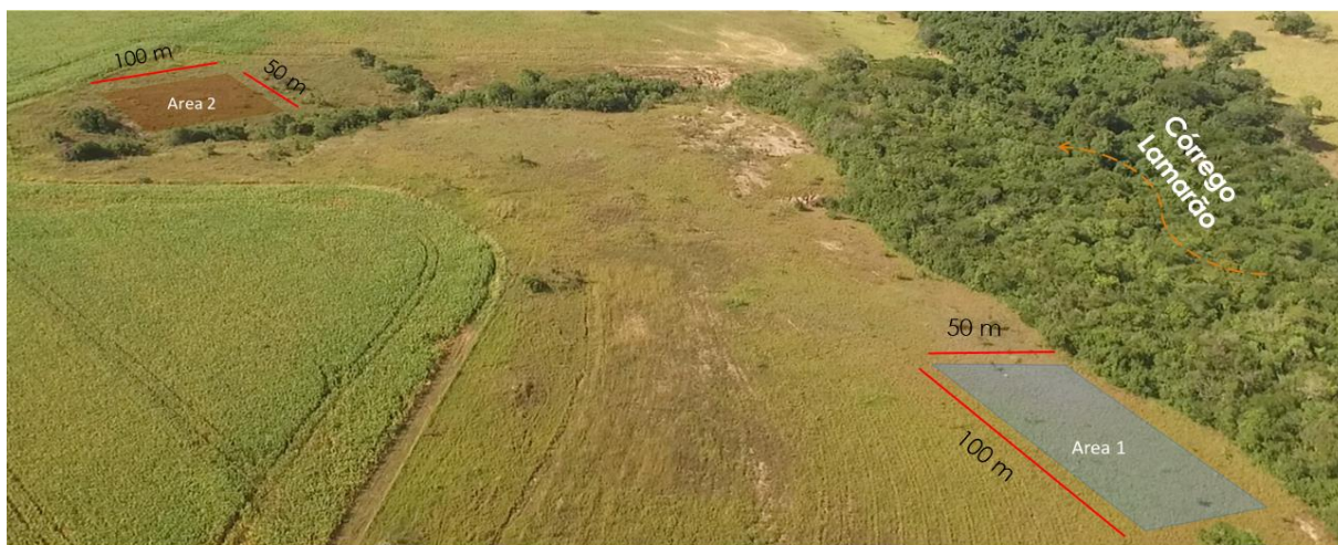
Figura 2. Áreas 1 (canto inferior direito) e 2 (canto superior esquerdo) do experimento de recuperação de área degradada, utilizando espécies nativas, via semeadura direta em Neossolo regolítico, na Fazenda Entre Rios, Paranoá, Distrito Federal.

A implantação do experimento foi realizada em duas áreas inclinadas de pastagens abandonadas sobre solo Neossolo Regolítico, (área 1 e 2) (Figura 2), e em uma área de agricultura abandonada sobre Latossolo vermelho (área 3) em terreno plano (Figura 3).