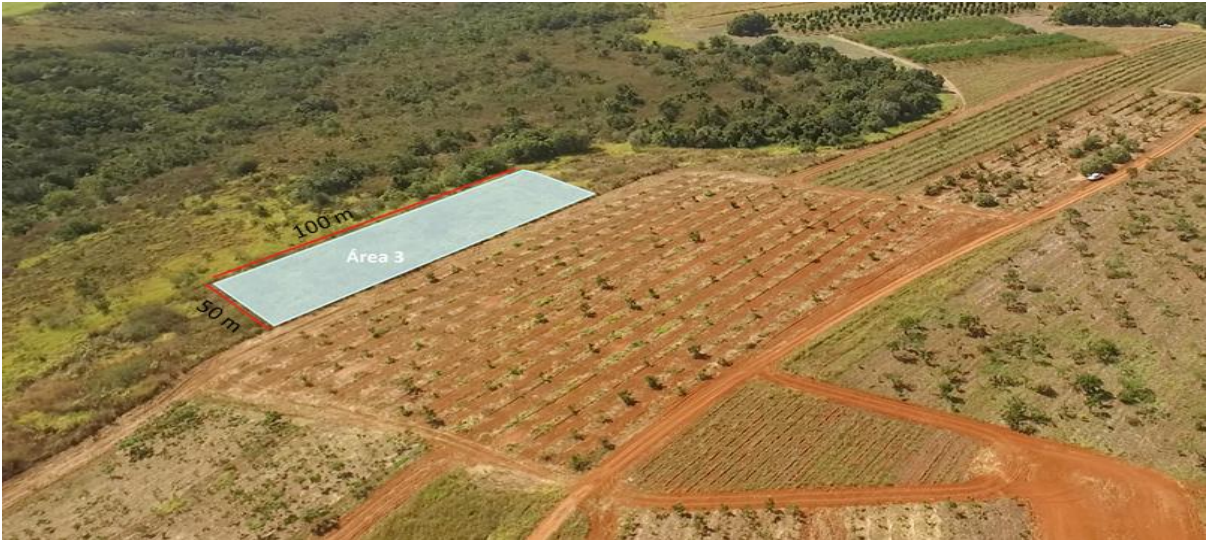
Figura 3. Área 3 (em destaque) do experimento de recuperação de área degradada, utilizando espécies nativas, via semeadura direta em Latossolo vermelho, na Fazenda Entre Rios, Paranoá, Distrito Federal.

Em cada área (100 x 50 m) (Figuras 2 e 3) foram feitas covas manualmente (0,30 cm de diâmetro e 5 cm de profundidade), espaçadas em 1 x 1 m e distribuídas em 36 linhas, paralelas a Mata de Galeria do córrego Lamarão, totalizando 2.520 covas por área. Em cada cova foi adicionado substrato comercial à base de casca de Pinus sp. compostada (Plantmax®) buscando facilitar as condições iniciais de germinação, emergência e sobrevivência das espécies.