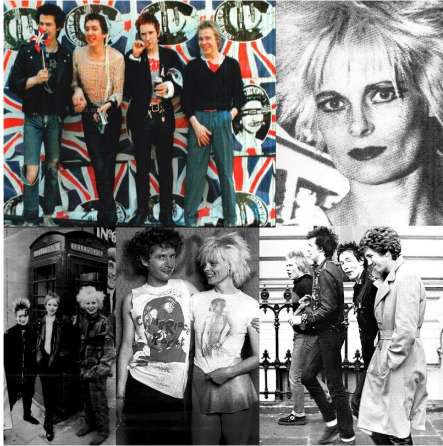
(Figura 1: Jovens na moda Punk anos 70. Fonte: Blogazine. Extraído em 20 de novembro de 2019)

“Essa é a característica básica da moda hoje: a amplitude do fenômeno entranhado na vida social, a estética do dia-a-dia, a criatividade em cada um de nós possibilitando ao indivíduo expressar o que é ou o que sonha ser no simples ato de se vestir.” (JOFFILY, 1991, p. 48).