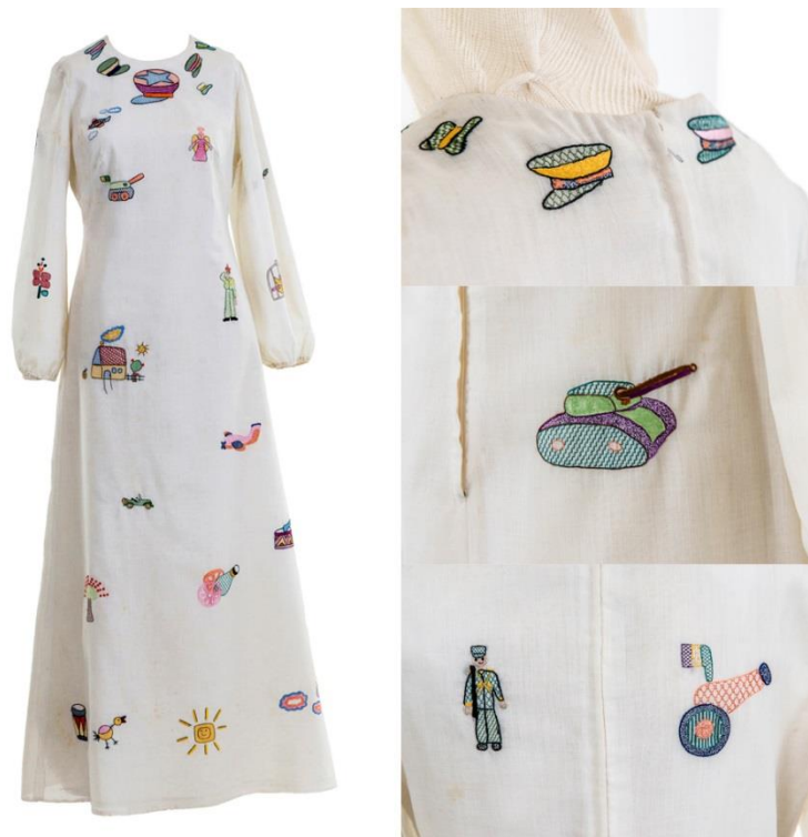
(Figura 3: Desfilhe Protesto de Zuzu Angel. Fonte: Acervo Instituto Zuzu Angel. Extraído em 12 de novembro 2019)

Durante os anos 80, diversas grifes nacionais e estilistas se consolidaram no país trazendo assim uma sua particularidade. Nos anos 90 a moda brasileira volta a se destacar no mercado e logo em seguida surge um dos primeiros eventos de moda do Brasil o Phytoervas Fashion.