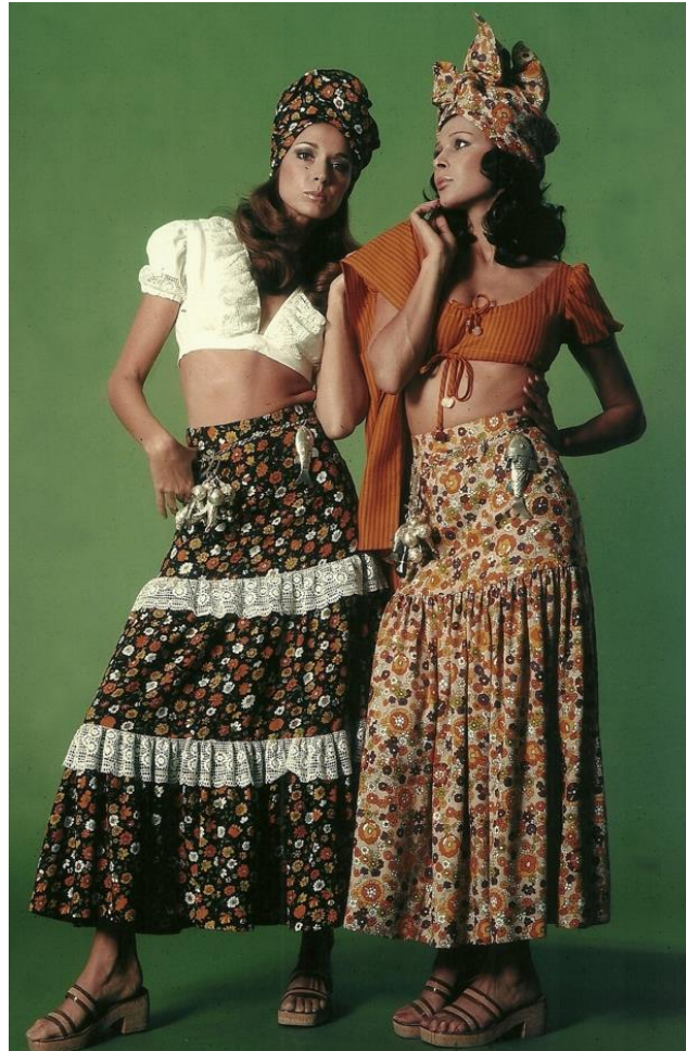
( Figura 2: As baianinhas de Zuzu Angel, coleção internacional Datiline Collection, 1972. Fonte: Acervo Instituto Zuzu Angel. Extraído em 12 de novembro 2019.)

No início dos anos 70 Zuzu Angel foi a primeira brasileira a levar seus looks para fora do Brasil, fazendo com que o mercado da moda brasileira mudasse totalmente de perspectiva, construindo assim uma identidade única para a moda brasileira.