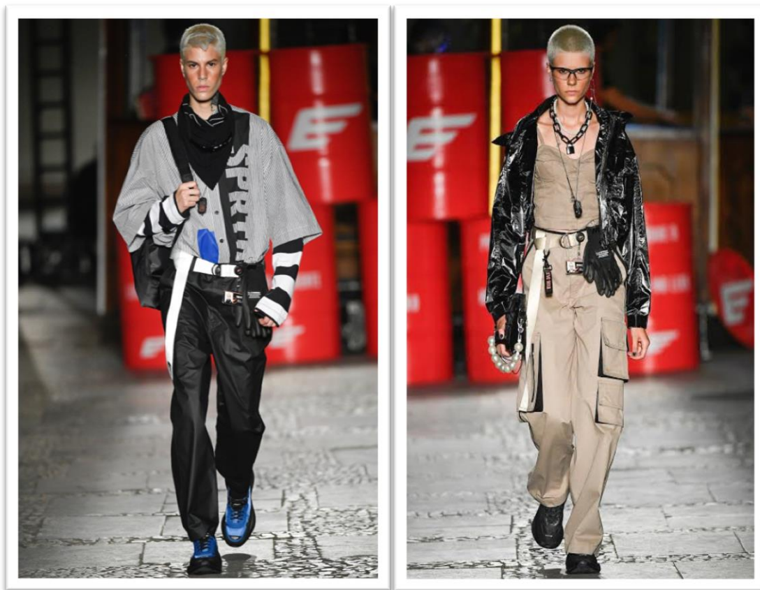
( Figura 6: Desfile de Abertura SPFW – Marca Ellus.)

O SPFW tem como principais objetivos ampliar as possibilidades e coordenar os movimentos que estão ocorrendo no mercado, fomentando assim a criatividade, a inovação e a criação da moda brasileira. O evento tem um período de realização de atividade de uma semana, trazendo um calendário de atividades como desfiles, palestras, oficinas, rodas de conversas e performances.