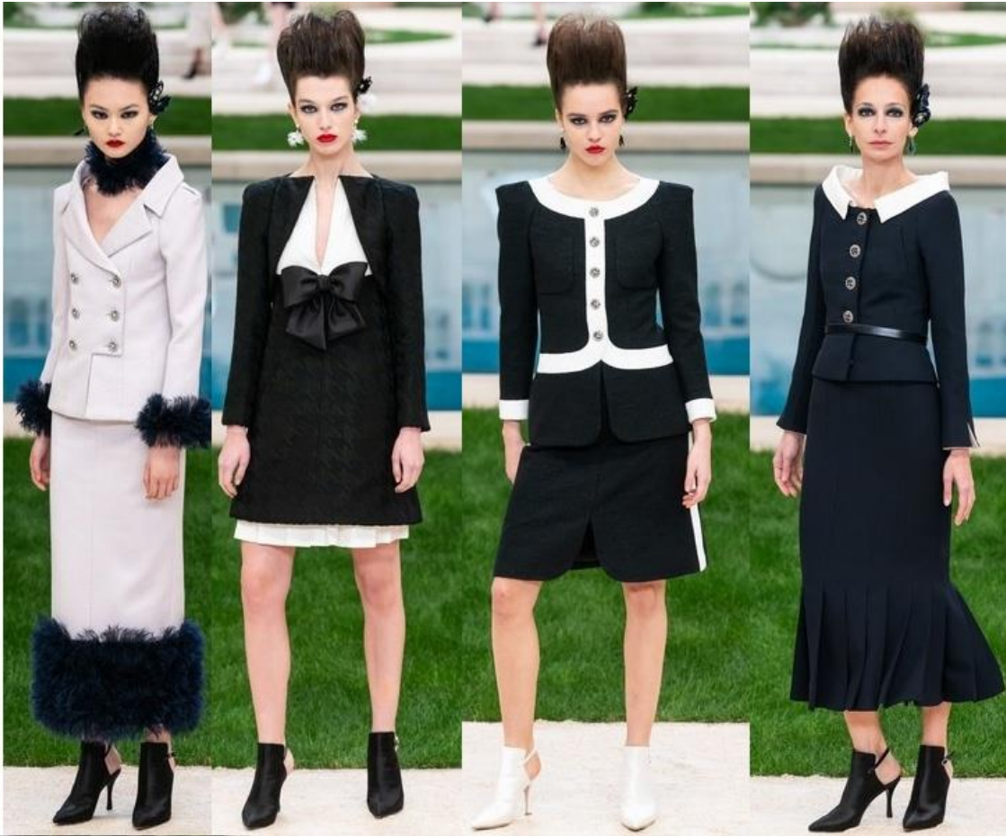
(Figura 3: Modelos em B&W Desfile CHANEL PFW 2019. Fonte: Blog Waufen. Extraído dia 10 de novembro de 2019)