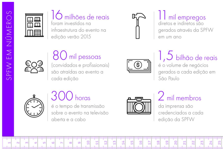
(Figura 6: História do São Paulo Fashion Week. Fonte: Site Stylight. Extraído em 20 de outubro de 2019)

Dados de 2015 mostram um pouco mais sobre como as atividades realizadas durante o SPFW: