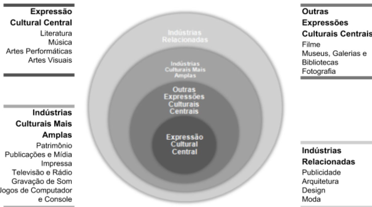
Figura 1 - Indústrias Culturais e Criativas: Modelo de círculos concêntricos