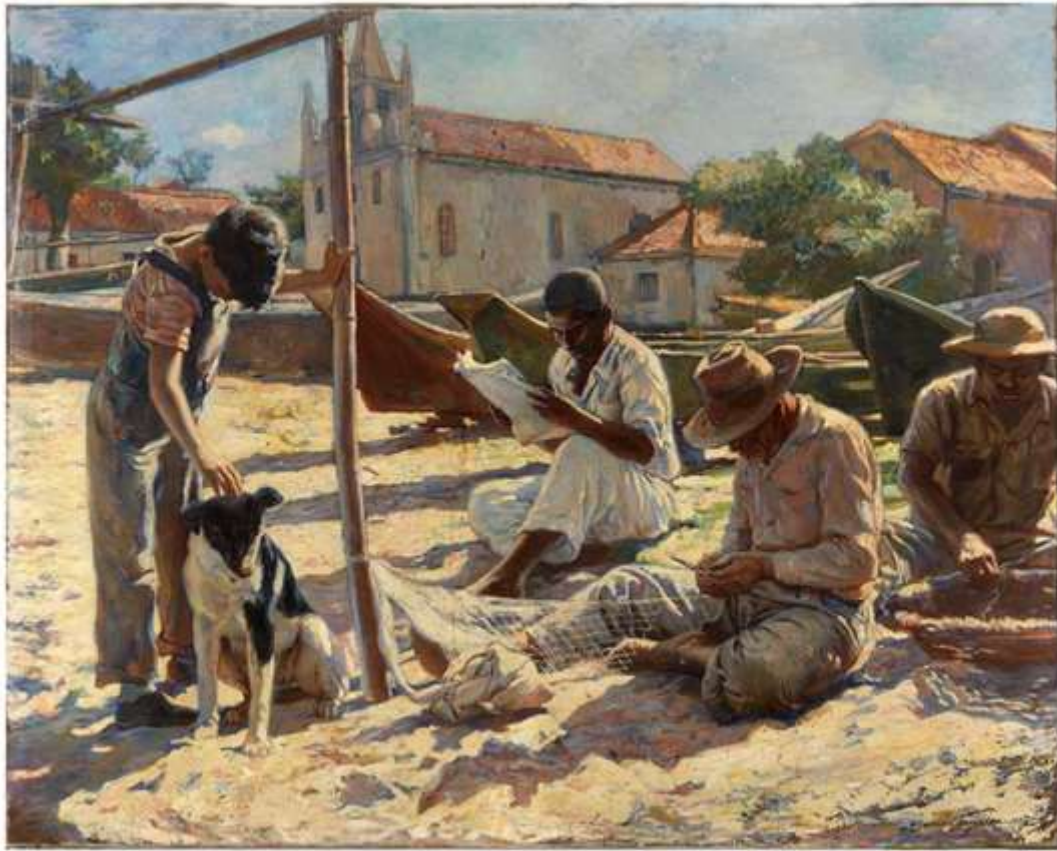
Figura 5 – Pescadores (1924) Fonte: Família do pintor, Coordenação de Documentação e Pesquisa – CDP, Departamento de Preservação do Patrimônio Cultural e Escola de Belas Artes – EBA. Propriedade da Universidade de New York.