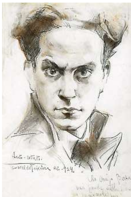
Figura 1 – Autp-retrato de Oswaldo Teixeira (1924) giz/carvão sobre papel azul, 23 X 16 cm. Coleção particular.

Natureza-Morta: Finitude e Negatividade em Adorno https://morte.uffc.com.br