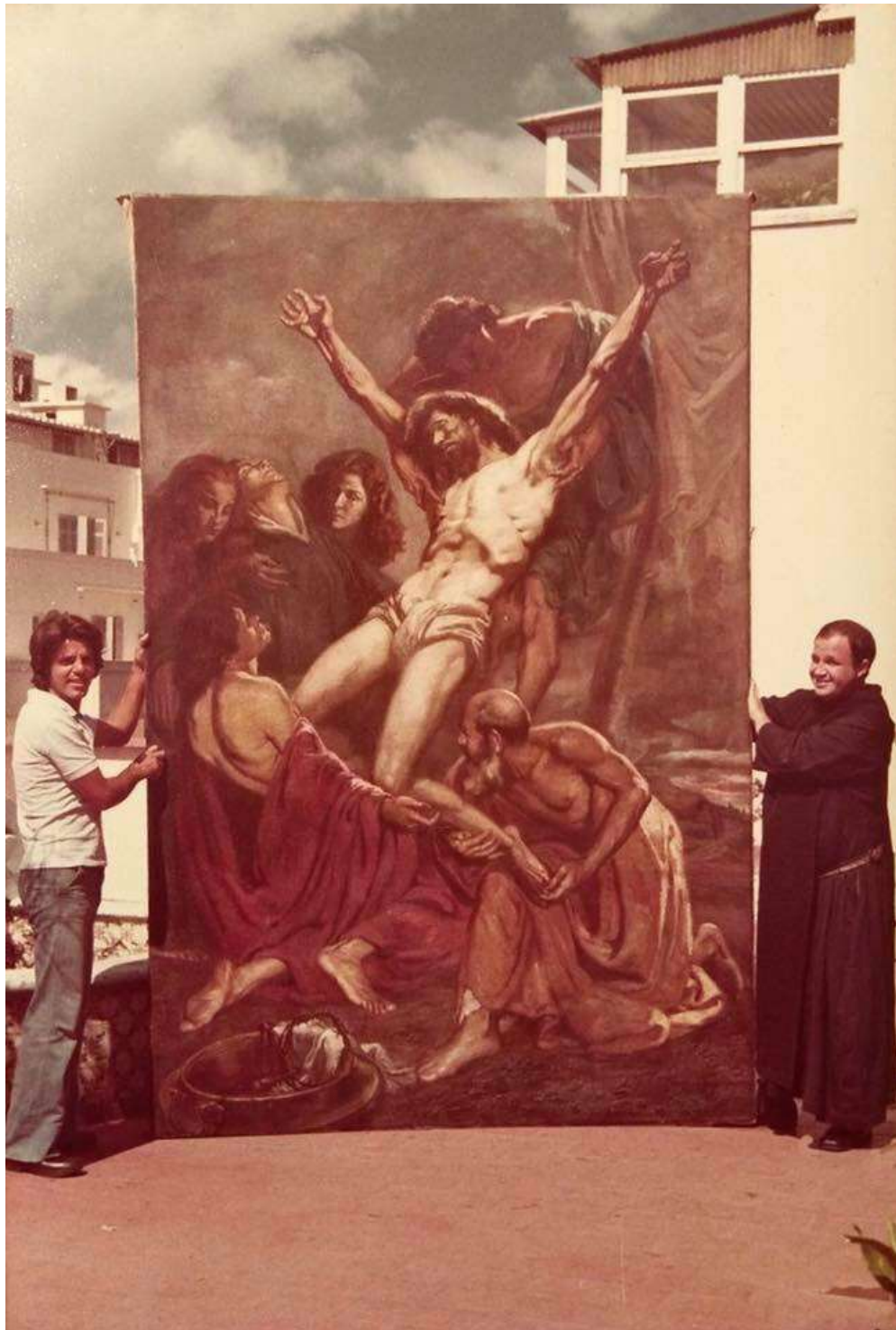
Figura 8 – Descida da Cruz (1920) Óleo sobre tela. 3 metros X 2,5 m.