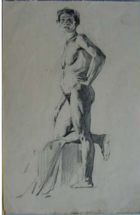
Figura 6 – Nu feminino em pé (1930) Creiom. 37 X 24cm.