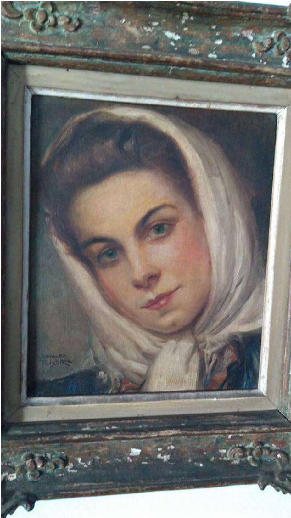
Figura 4 – Retrato de Olga (1929). Óleo sobre tela.