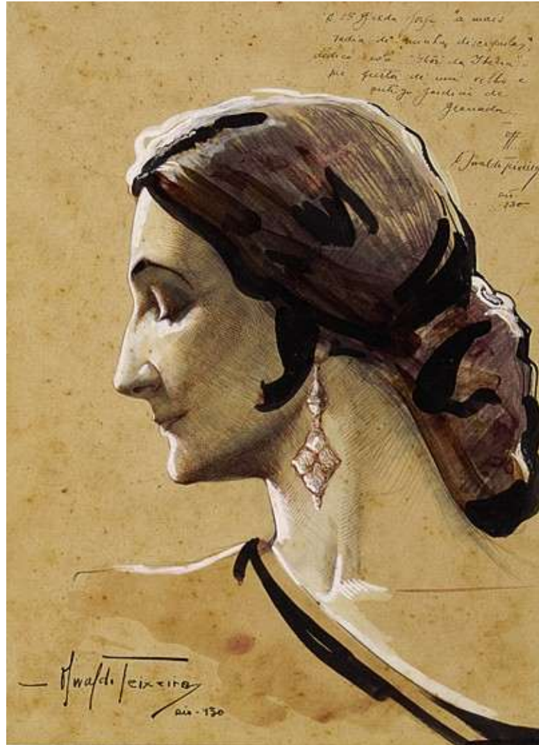
Figura 5 – Desenho (1930)