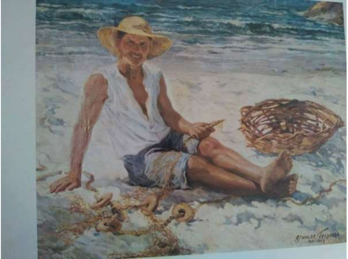
Figura 2 – O pescador (1929). Óleo sobre tela. 130.70 cm x 163.20 cm.

Um outro ponto significativo foi sua passagem pela antiga Escola de Belas Artes, onde obteve orientação de Rodolfo Chambelland (1879/1926) em desenho de modelo vivo e de Batista da Costa (1865/1926) em pintura; e conquistou, em 1924, o prêmio de viagem à Europa com 19 anos, com o quadro O pescador. Dessa forma, não podemos deixar de mencionar que foi o mais jovem artista a receber a distinção em toda a história da Instituição e o único pintor brasileiro a receber todas as honrarias possíveis em sua categoria e um dos mais premiados pintores brasileiros.