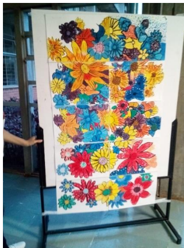
Figura 5 – Arco-Íris. Exibido no III Seminário Internacional FS Promotora de Saúde, 2018

Outra atividade foi a produção coletiva de um painel de pintura (Figura.4), o qual foi selecionado para exibição durante o I Encontro da Rede Brasileira de Universidades Promotoras da Saúde, III Seminário Internacional FS Promotora de Saúde e I Mostra de Experiências Promotoras de Saúde.