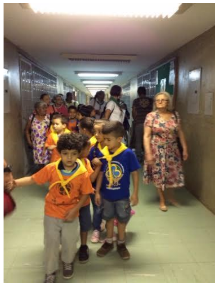
Figura 2 – Visita ao Museu de Anatomia da Faculdade de Ciências da Saúde (FS), UnB, 2016