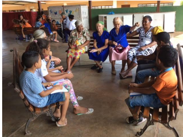
Figura 1 - Sessão de reminiscências onde as crianças aprendem e registram como era fiado o algodão