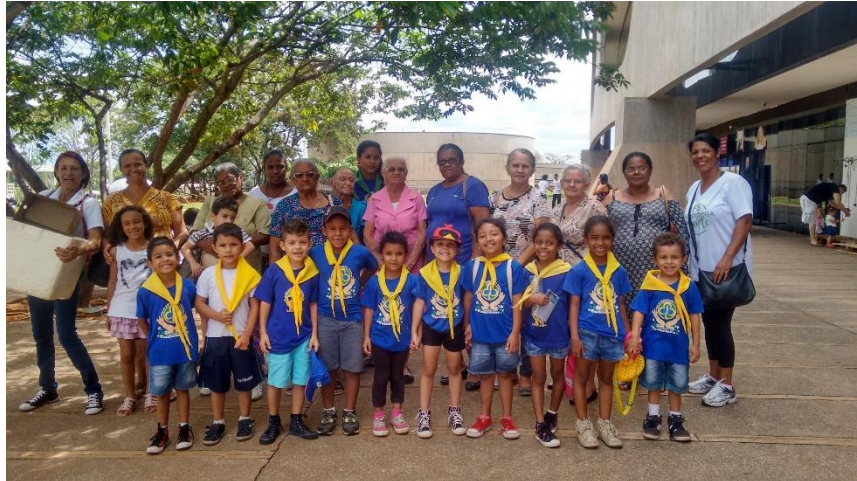
Figura 3 – Passeio ao Centro Cultural Banco do Brasil (CCBB), 2016

A Federação de Bandeirantes do Brasil é uma instituição não governamental que utiliza princípios de vivência de valores contidos no Código e na Promessa Bandeirante. Inclui o trabalho em equipe, o aprender fazendo, a auto progressão, a vida ao ar livre, a expressão e simbolismo, a convivência entre jovens e adultos e serviços na comunidade (Sitio eletrônico - Movimento Bandeirantes, São Paulo, 2016).