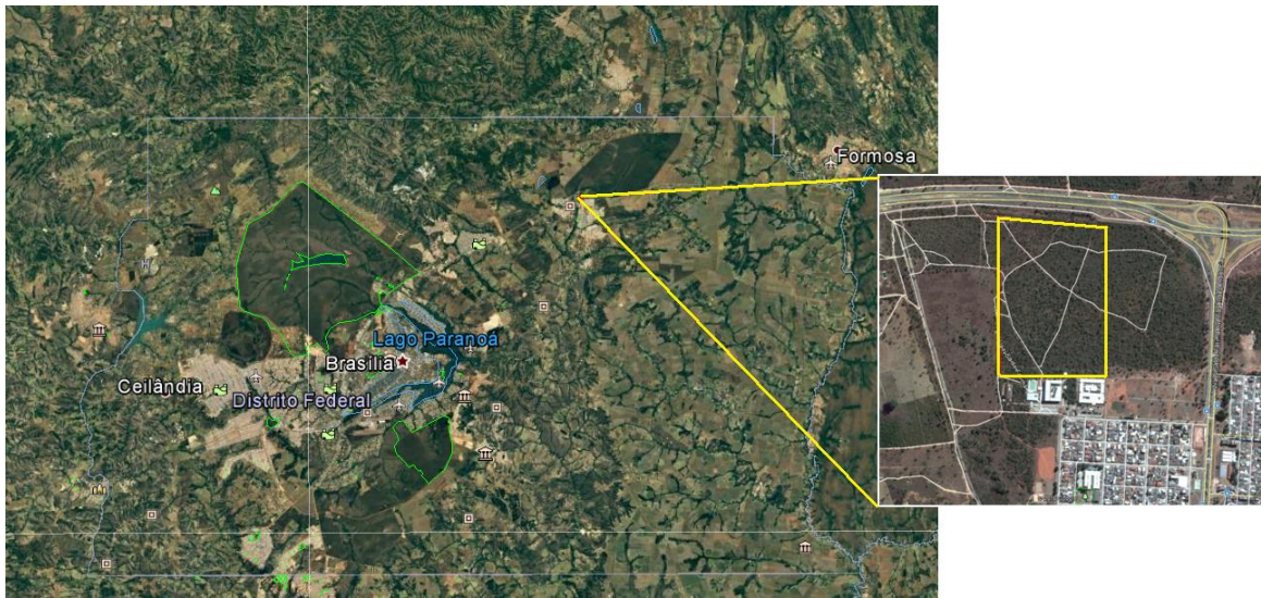
FIGURA 1: Área total do DF, com ampliação na área de Planaltina/DF. O retângulo amarelo representa o Cerrado ao lado da UnB de Planaltina onde foi realizado o trabalho.

Para as estimativas de herbivoria, foram demarcadas cinco parcelas de 50m x 1m (50m 2 ) (FIGURA 2) durante o mês de março de 2017 (no final da estação chuvosa e início da seca). Todas as plantas do estrato rasteiro (com altura inferior a 1m) e que estavam dentro da parcela foram inspecionadas quanto à presença de sinais de herbivoria (herbívoros mastigadores e minadores) em suas folhas. Sinais de sugadores não foram levados em consideração. As plantas foram classificadas em gramíneas e não gramíneas, com ou sem sinais de herbivoria.