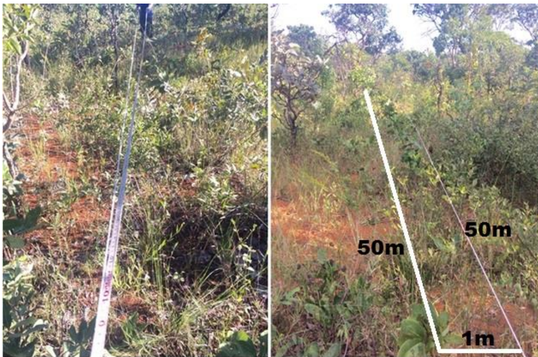
FIGURA 2: Parcela utilizada para observação das plantas quanto o sinal de herbivoria. (FOTO: GONÇALVES, 2017).

Para as estimativas de herbivoria, foram demarcadas cinco parcelas de 50m x 1m (50m 2 ) (FIGURA 2) durante o mês de março de 2017 (no final da estação chuvosa e início da seca). Todas as plantas do estrato rasteiro (com altura inferior a 1m) e que estavam dentro da parcela foram inspecionadas quanto à presença de sinais de herbivoria (herbívoros mastigadores e minadores) em suas folhas. Sinais de sugadores não foram levados em consideração. As plantas foram classificadas em gramíneas e não gramíneas, com ou sem sinais de herbivoria.