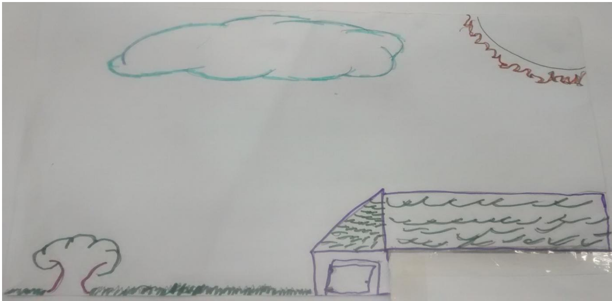
Figura 3 - Desenhe o lugar onde você vive

*A parte da casa está coberta, porque o aluno desenhou o seu nome.