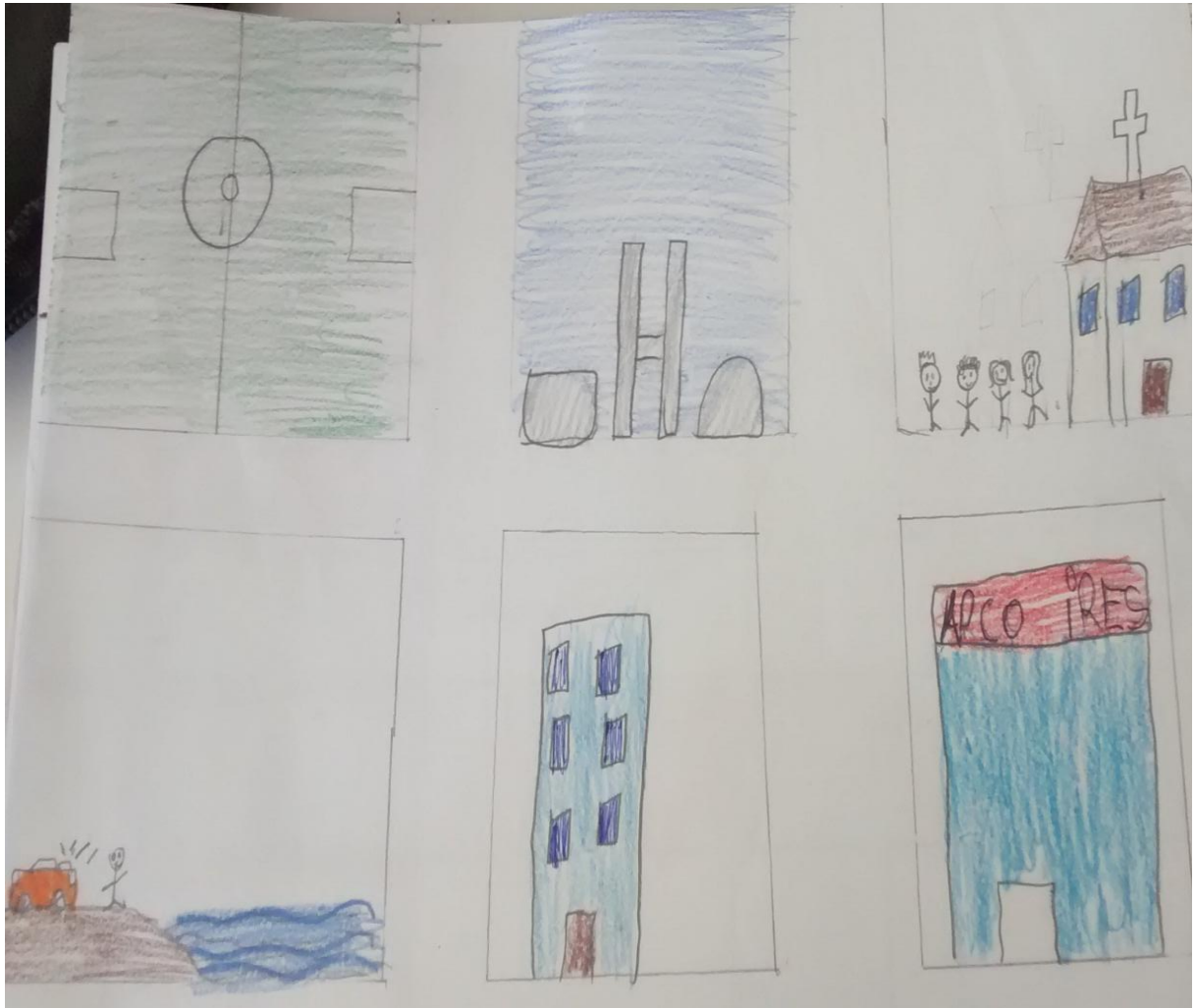
Figura 2 - A9 Desenhe a sua cidade

É possível encontrar nesse desenho elementos do trajeto casa-escola efetuado pela criança, bem como elementos da Vila Planalto, sua cidade, e elementos que fazem parte da sua rotina de lazer como por exemplo, o Lago Paranoá, ou o campo de futebol. Refletir sobre esse desenho, nos revela que o aluno compreende a sua cidade em um âmbito maior do que a Vila Planalto, ao acrescentar o Congresso Nacional e o Lago Paranoá no desenho que deveria ser da sua cidade. Pensar a cidade, nesse caso, resulta em um desenho dos lugares com os quais o aluno tem algum tipo de relação, infere – se que existe um equívoco na concepção de cidade, ou ainda, a ausência da concepção de Lugar, anteriormente tratada nessa pesquisa. Perceber essa dicotomia entre Lugar x Cidade ocasiona as primeiras descobertas sobre a