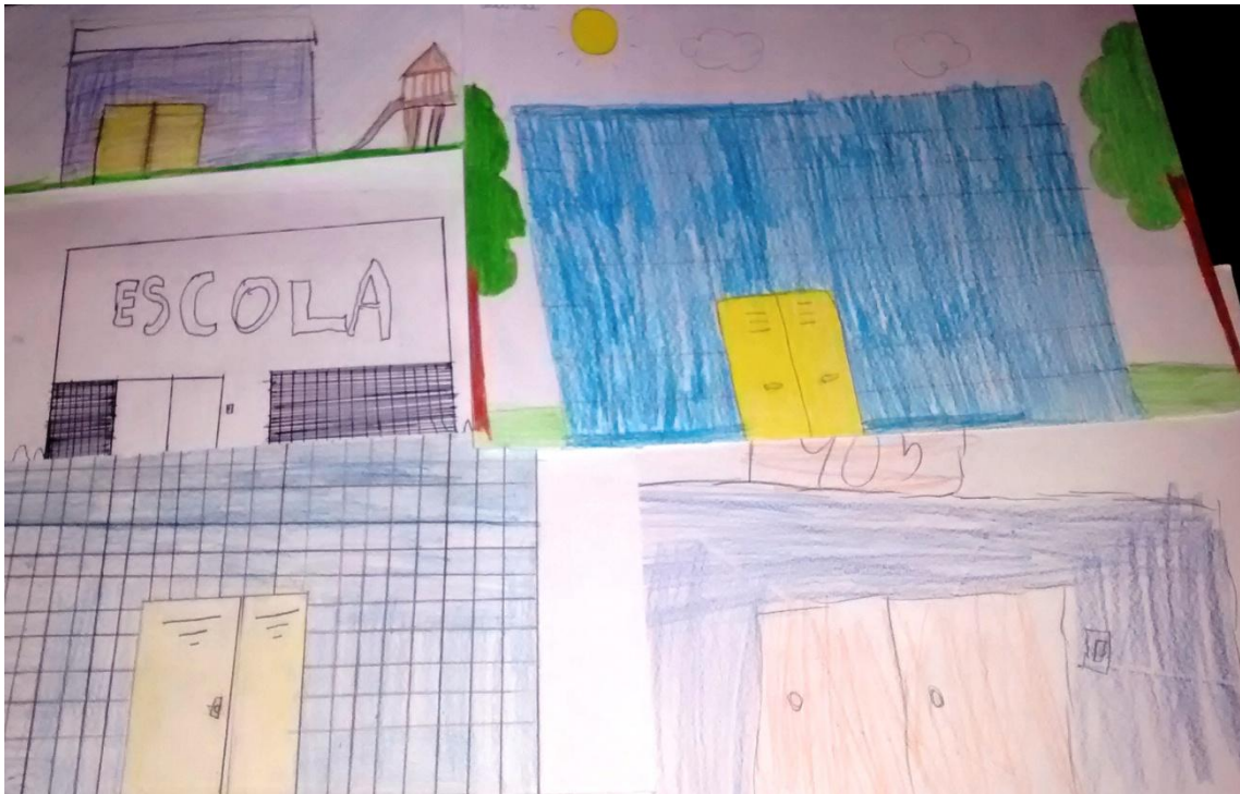
Figura 4 - A2,A6,A8,A9,A10 - Desenhe o lugar onde você estuda

No segundo encontro do grupo focal, que aconteceu com as mesas dispostas em roda, quando os alunos voltaram do recreio, e contou com participação de dois estagiários. A conversa foi iniciada trazendo a temática do que seria Espaço para eles. Nesse sentido, responderam que o espaço é a sala, é o pátio, é a cadeira e muitos outros ambientes. Ao perguntar o o que seria o lugar, muitos o identificaram como espaço. Ao questionar se havia diferença entre ambos, a resposta quase unânime foi não. A partir disso, retomou-se a reflexão acerca do que é o espaço, com exemplos do cotidiano. A conclusão atestou que lugar é um tipo de espaço, e que os lugares estão dentro dos espaços. Entretanto, pode-se afirmar que as crianças entenderam que o lugar tem um sentido especial a elas, conforme atesta a seguinte fala: “É simples. O campinho que a gente joga lá na Vila, é um lugar nosso, nosso lugar de jogar bola e zuar, mas, a tia olha o campinho e vê só um espaço. É isso tia?” (aluno A13).