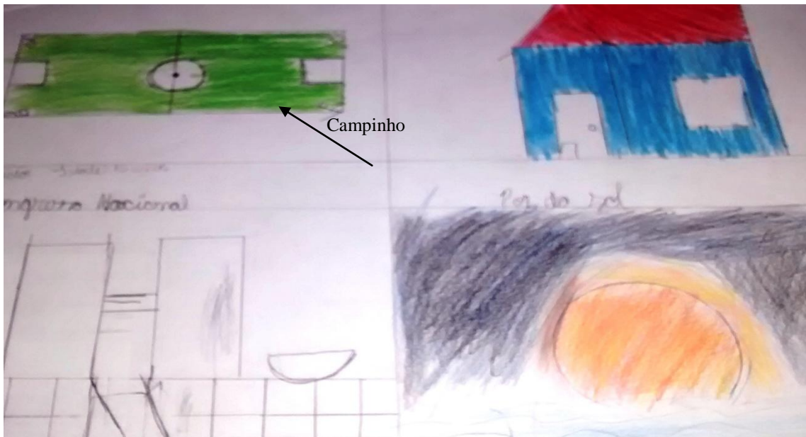
Figura 5. A13 - Desenhe onde você vive