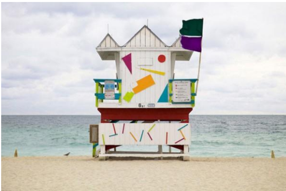
Figura 13 fotografia, Leo Caillard

Leo Caillard também se relaciona dessa forma com alguns movimentos artísticos. Fotografa construções, retratando os postos de salva vidas nas praias de Miami, nos Estados Unidos.