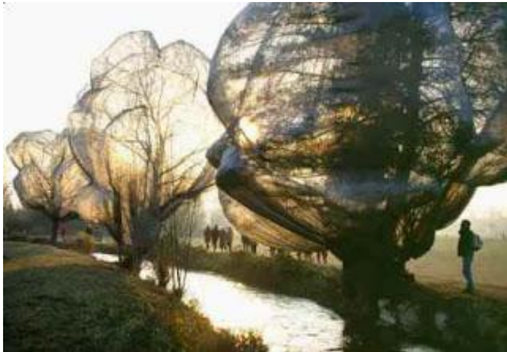
Figura 8 Christo, Wrapped Trees, Switzerland, 1998

outrora seria ou não considerado arte ficaram reduzidas. Dentro dessa corrente também estão alocadas a arte processo, arte ambiental e a instalação. Na Arte Ambiental (Land Art), por exemplo, a geografia torna-se a obra. Christo (n. 1935) e Jeanne-Claude (1935 – 2009) embrulham árvores, pontes, prédios e até mesmo ilhas.