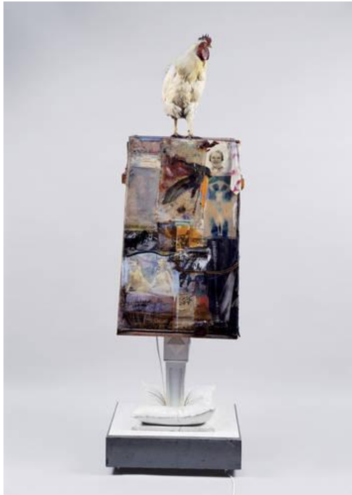
Figura 6 Rauschenberg ,Odalisk, 1955-58. Tinta a óleo, aquarela, crayon, pastel, papel, tecido, fotografias, reproduções impressas, modelo em miniatura, jornal, metal, vidro, capim seco, palha de aço, um travesseiro, um poste de madeira e lâmpadas em uma estrutura de madeira montada sobre quatro rodízios e encimado por um galo de pelúcia.

Entrando na contemporaneidade, acumulam-se inovações e lampejos de expressividade no âmbito do material, originários de vários artistas do fim da década de 1950. Os movimentos Pop Art, Minimalismo e a Arte Conceitual seguem com a comunicação de pensamentos modernistas. Destaca-se a produção de Rauschenberg (1925 – 2008), marcada pelo uso de sucatas, buscando aproximar sua arte do mundo real, pois assim o considerava.