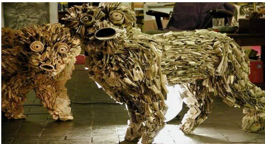
Figura 16 Nick Georgious, escultura papel jornal e páginas de livros

"Ao tirar toda a informação e começar do zero usando a folha de papel em branco A4 para minhas criações, eu sinto que encontrei um material que todos nós somos capazes de se relacionar, e ao mesmo tempo, a folha A4 é neutra e está aberta para ser preenchida com significado diferente. O papel fino branco dá as esculturas de papel uma fragilidade que reforça o tema trágico e romântico dos meus trabalhos. As esculturas com corte de papel exploram a transformação provável e mágica da folha plana de papel em figuras que se expandem para o espaço em torno delas. O negativo e ausente duas dimensões do espaço deixado pelo corte, apontam o contraste com a realidade da terceira dimensão. Neste sentido há também um aspecto trágico em muitos dos cortes (AOCS,LUÍS)".