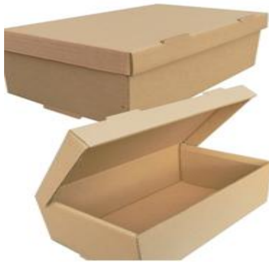
Figura 21 - caixas de papelão usadas como recurso

E tomando como referencial esses artistas e os conceitos estabelecidos recorreremos ao uso de caixas de papelão na metodologia aplicada, inicialmente por causa da facilidade de aquisição, em consequência também de dificuldades de esculpir com determinados materiais no espaço escolar. Utilizamos a estrutura de caixas, formatos e dimensões na elaboração de obras que tomem forma de casas, a partir das premissas do construtivismo, as poéticas dos alunos, e as referências de Anna Mariani e Leo Caillard.