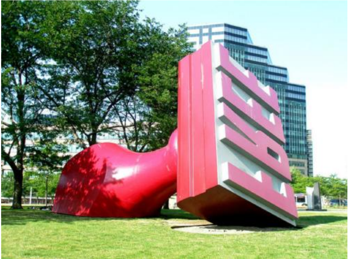
Figura 7 Claes Oldenburg, Aço e alumínio, pintado com esmalte poliuretano, Willard Park, Cleveland, Ohio

O escultor americano Oldenburg (n. 1929) também utilizou objetos cotidianos em seus trabalhos, trazendo para a obra o avesso desses objetos, o outro lado, a oposição. Intencionava retirar do expectador o significado implícito do objeto como objeto.