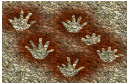
Figura 1 - Mãos em negativo da caverna de Gargas

Os temas utilizados por esses primeiros pintores são principalmente a retratação de animais, mas variam entre figuras humanas e cenas de batalhas, com evidente preocupação cada vez maior com o realismo, a tridimensionalidade e a demarcação de sua presença. Parece haver uma necessidade de registrar sua passagem por esses locais, como através do negativo das mãos.