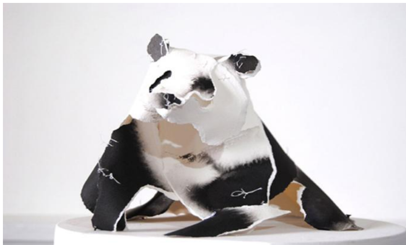
Figura20 Anna Wili Highfield, papel costurado

Anna Willy é uma artista australiana com afinidade com as características esculturais do papel, trabalhando essa expressividade com animais. A artista incorpora suas obras à vitrines de marcas de luxo, relacionando suas criações a produtos como roupas e outros acessórios. Foi cenógrafa do Ópera Austrália, e usa a costura como forma de unir as partes do material.