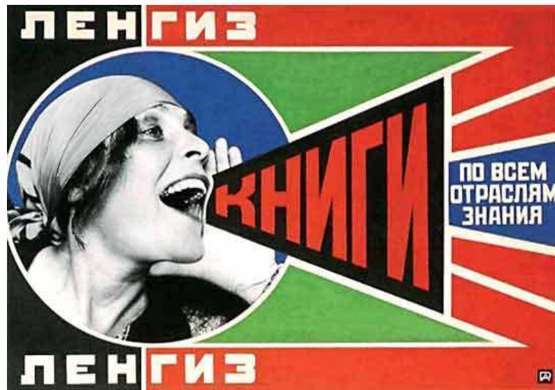
Figura 23 Rodchenko "Livros". Cartaz para o departamento estatal da imprensa de Leningrado, 1924