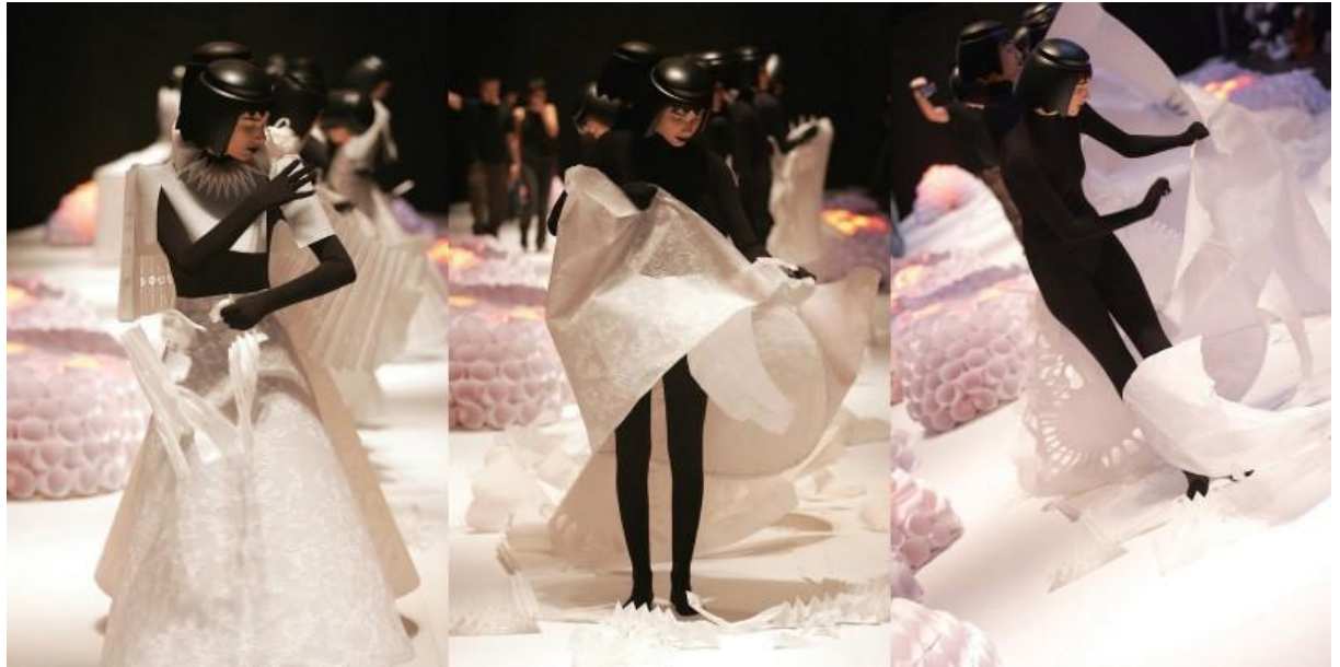
Figure 10 Cenas do desfile de roupas produzidas com papel vegetal do design Jum Nakao em 2004

O papel tem sua origem há pelo menos dois mil anos, e criado pelos chineses a partir de fibras vegetais, provavelmente amoreira e cânhamo. As fibras são cozidas, maceradas, e a essa mistura posteriormente é adicionada água, que é coada com o auxílio de moldes e posta para secar. Esse processo tornou-se muito viável devido à facilidade e baixos custos.