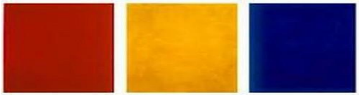
Figura 22 Rodchenko Título: Vermelho Puro, Amarelo Puro e Azul Puro.

cores primárias, considerando a prevalência no construtivismo dessas cores. Os padrões das pinturas seguem regras de geometrização.