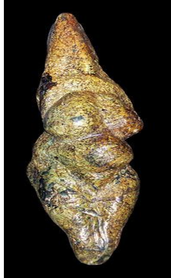
Figura 2 Vênus de Savignano

A construção das primeiras moradias a partir do barro, da pedra e da madeira dá origem aos princípios da engenharia da arquitetura, já que esses homens precisavam conceber construções que fossem resistentes a intempéries, com materiais que mantivessem certo conforto climático. Um grande espaço de tempo marca o último período da pré-história conhecido como Idade do Metal, tem-se um enorme avanço na técnica de confecção de instrumentos, artefatos e objetos, marco na história de feitura e manipulação de materiais, conforme Campelo, Matter, Guimarães, Costa e Barbosa.