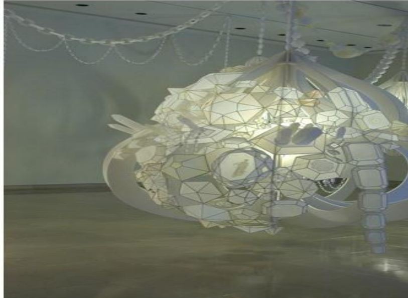
Figura 17 Kirsten Hassenfeld, Dans La Lune,2007

A artista Americana Kirsten Hassenfeld trabalha com o papel e luz. Seus trabalhos lembram candeeiros, lustres, ou qualquer objeto de iluminação. A luz e o modo como incide transformam a percepção do expectador. Seus trabalhos são formas que remetem a pedras preciosas e objetos de vidro, gotas gigantes e cúpulas com inspiração na arquitetura russa