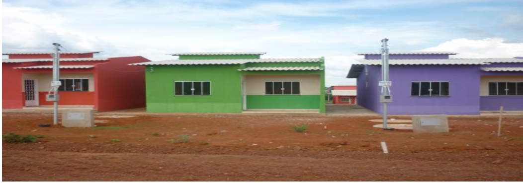
Figura 11 - Figura fachada de casas do conjunto habitacional Morada Nobre em Santo Antonio do Descoberto

Em que momento esse recorte local se relaciona com o conhecimento e a aprendizagem em artes visuais? Esse contexto da comunidade discente da Escola Municipal Guillon Ribeiro, demanda várias problemáticas, entre elas o preconceito em relação aos alunos moradores de casas doadas por programas de baixa renda. O conjunto habitacional intitulado oficialmente de Morada Nobre, passa a se chamar informalmente Morada Pobre. Causam certa inquietação essas relações de poder de cunho sócio-econômico, revestidos de uma demanda capitalista, de modo que a partir dessa realidade é norteado esse trabalho.