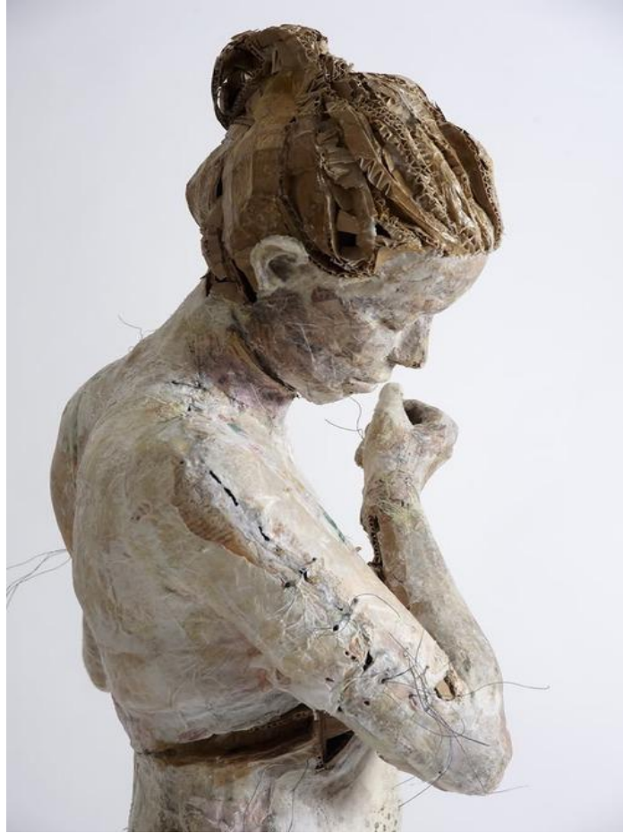
Figura 14 –Escultura da artista Vally Nomidou

A artista experimenta todas as potencialidades do recurso, costura, cola e cozinha o papel para conseguir a textura que deseja, não utiliza cor, explora a pigmentação própria dos papeis escolhidos.