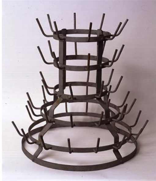
Figura 5- M. Duchamp, porta-garrafas