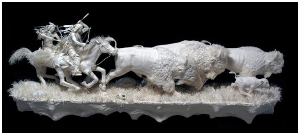
Figura 15 Escultura do artista Patty Eckman

A artista experimenta todas as potencialidades do recurso, costura, cola e cozinha o papel para conseguir a textura que deseja, não utiliza cor, explora a pigmentação própria dos papeis escolhidos.