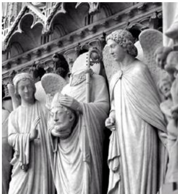
Figura 3 - Esculturas da fachada da Catedral de Notre Dame na França

Sem deixar a arquitetura de lado temos o advento das catedrais góticas, verdadeiras maravilhas a serviço do cristianismo. Essas catedrais góticas estabelecem uma linha entre a arquitetura românica e a gótica. É um período em que a arquitetura e a escultura estiveram bem próximas, e a escultura existiu em função da arquitetura.