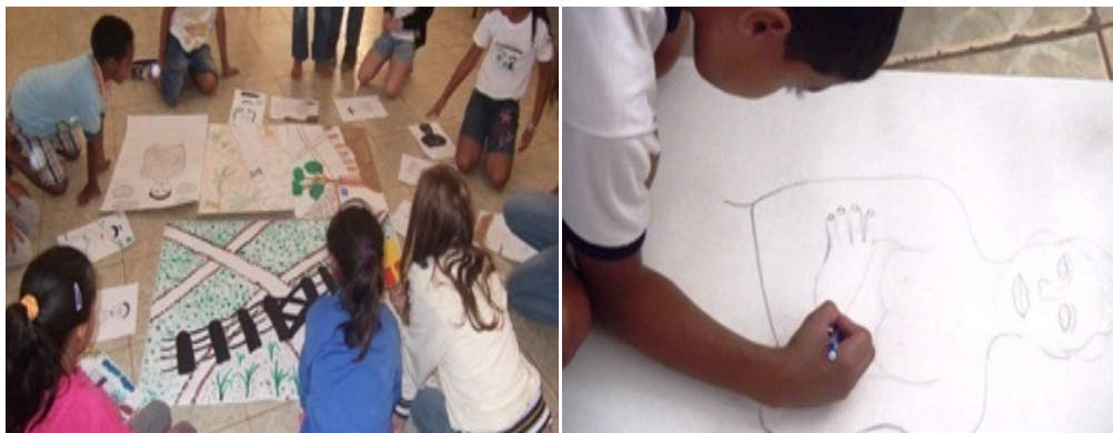
Figura 3 - Alunos realizando a releitura de Mestiço