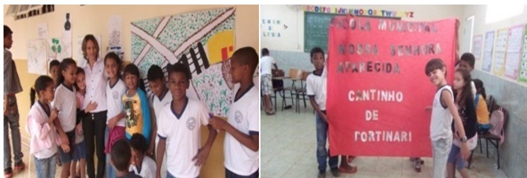
Figura 4 - Exposição dos trabalhos dos alunos

A etapa final desta aula culmina com a apresentação dos trabalhos realizados pelos alunos em um mural na escola, onde toda a comunidade escolar pode apreciar e conhecer as produções de arte. Devido há alguns contratempos na escola o encerramento das atividades teve uma alteração na data com o acréscimo de mais duas aulas.