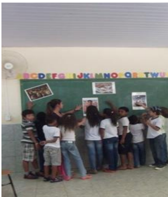
Figura 2– Alunos observando obras de Portinari.

desde criança?”, “O artista pintava muitas crianças brincando é por que, brincava muito com elas?”, “Por que ele se preocupava tanto com as questões sociais do nosso país?”, “Candido Portinari era negro, ou mestiço, era grande ou pequeno?”, “Por que ela não se cuidou para não morrer tão jovem?”