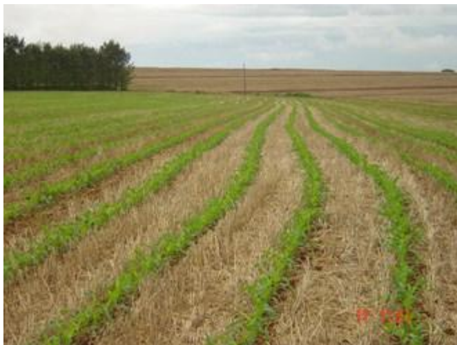
Imagem 4: Plantio direto

qualidade, necessitando menos de adubação, além do fato de diminuir a incidência de doenças, já que o sistema deve ser acompanhado da rotação de culturas. Há também nesse sistema, um consumo menor de diesel, pois não é necessário revolver o solo, fazendo com que o produtor gaste menos.