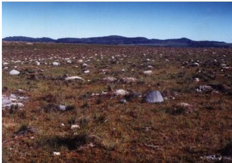
Imagem 2: Pastagem degradada

Com a recuperação dessas áreas, é evitada a necessidade de abertura de novas fronteiras agrícolas e transformação de novas áreas nativas em pastagens.