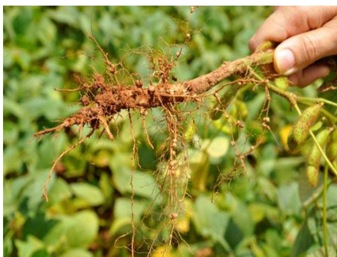
Imagem 5: Fixação Biológica de Nitrogênio

Atualmente 100% da produção de soja brasileira utiliza a fixação biológica de nitrogênio. O governo espera reduzir em 100% a utilização de fertilização química nitrogenada no feijão e outras leguminosas, 50% na cana-de-açúcar e 40% no milho e no trigo (EMRAPA, 2012c).