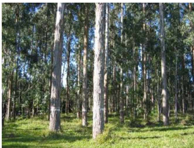
Imagem 6: Floresta de eucalipto

As espécies mais comumente plantadas hoje em dia, segundo levantamento do MAPA (2012f), são o eucalipto, pinus e a acácia-negra, porém outras espécies também estão sendo utilizadas, como a araucária, a seringueira, o populus, a teca, o paricá, dentre outras.