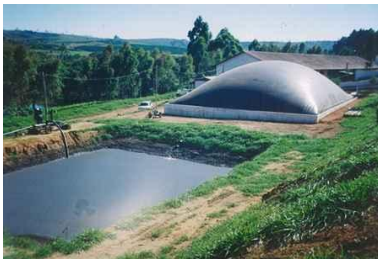
Imagem 1: Biodigestor (Imagem da internet)