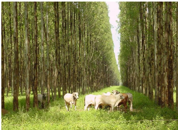
Imagem 3: Integração Pecuária-floresta