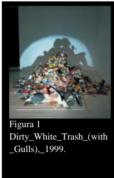
Figura 1 Dirty_White_Trash_(with _Gulls),_1999.

Arte é um berço fértil de novas possibilidades. Possibilidades essas que se transformam em inquietações para tornar possível a arte. Arte não é apenas o que a retina dos nossos olhos se agrada, o que a nossa mera vontade sacia, É a partir dessas infinitas possibilidades que o ser humano evidencia a transformação e ressignificação do lixo em arte. São essas possibilidades que ampliam a capacidade de criar e recriar que se manifesta no ser humano ao transformar resíduos em obras de arte.