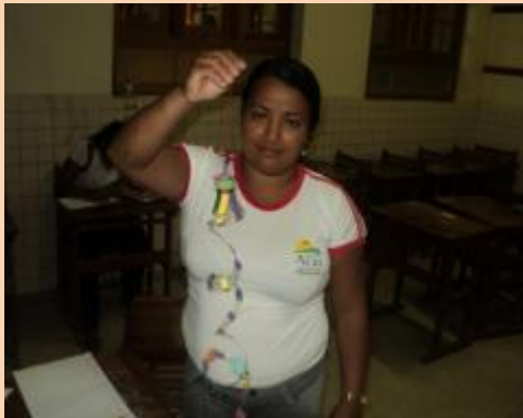
Figura 6- Experiência concreta-móvil feita com garrafa pet pelos os alunos.

A partir de então, eles eram responsáveis pela transformação daqueles materiais recicláveis em arte. Foi muito gratificante, pois aqueles alunos que não participavam das aulas e não gostavam de se expressar, ficando pelos cantos da sala, tiveram a oportunidade de expressar sua criatividade fazendo móveis lindos. Nos relatos agradeceram a oportunidade que tiveram de fazer algo diferente, dinâmico, legal e que certamente iriam praticar com seus filhos em casa. Nesse momento pude contemplar o papel de um arte/educador verdadeiramente comprometido como mediador, propagador e disseminador de conhecimentos na sala de aula.