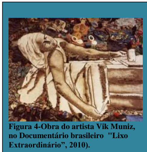
Figura 4-Obra do artista Vik Muniz, no Documentário brasileiro "Lixo Extraordinário", 2010).

puderam ampliar sua visão de mundo. A partir daquele momento, é provável que nunca mais olhem para o lixo da mesma forma ou com o mesmo pensamento, uma vez que os materiais se tornarão recicláveis em suas vidas e a arte nunca mais será ignorada por eles. Na verdade, os catadores de materiais recicláveis, depois desse documentário começaram primeiramente a se enxergar de maneira diferente.