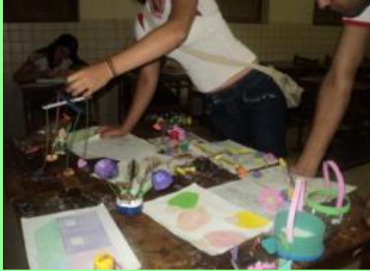
Figura 5- materiais para construção das obras de artes.