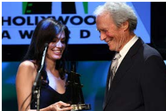
Figura 14. Clint e Angelina Jolie, 2008