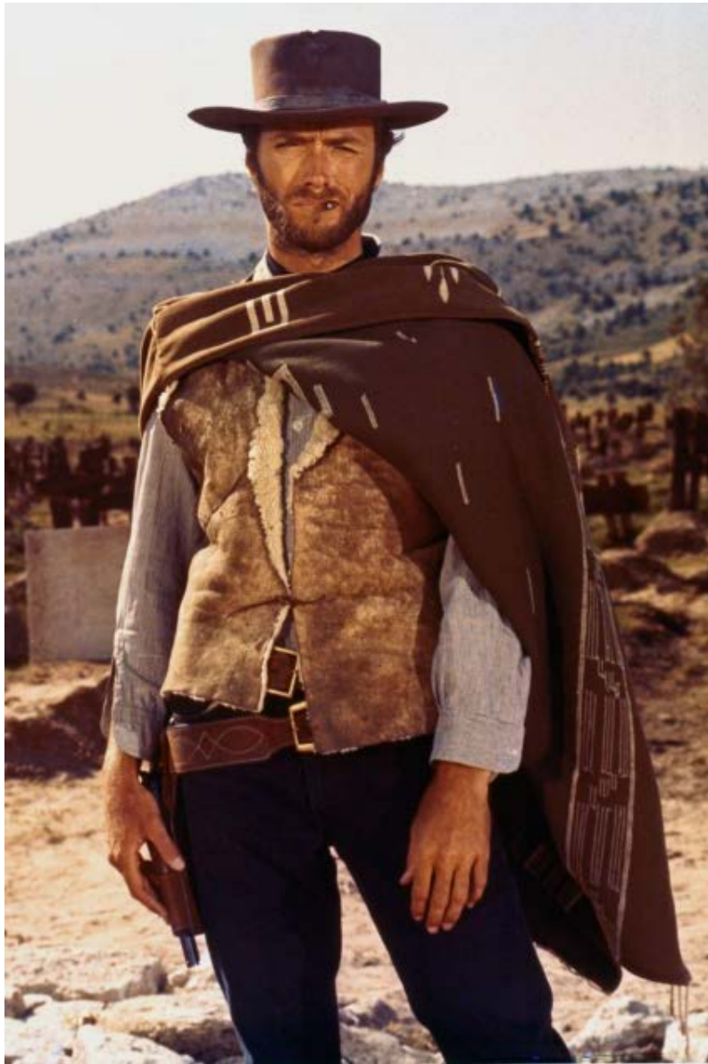
Figura 02. Clint Eastwood, 1966.