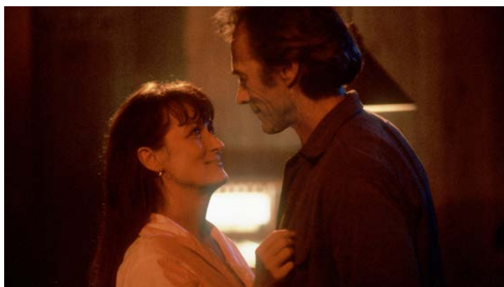
Figura 05. Clint Eastwood e Meryl Streep, 1995