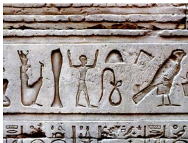
Figura 02. Hieróglifos