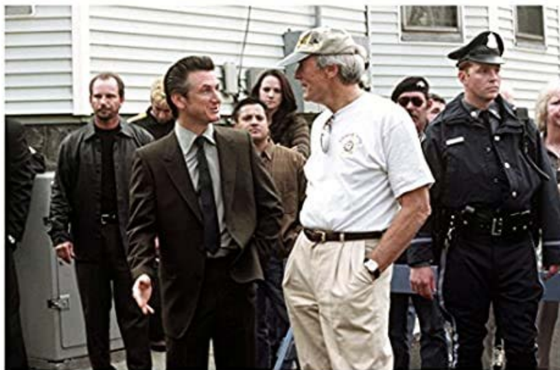
Figura 09. Clint Eastwood e Sean Penn, 2003.