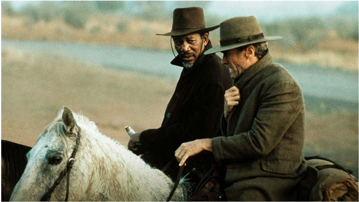
Figura 08. Clint Eastwood e Morgan Freeman, 1992.