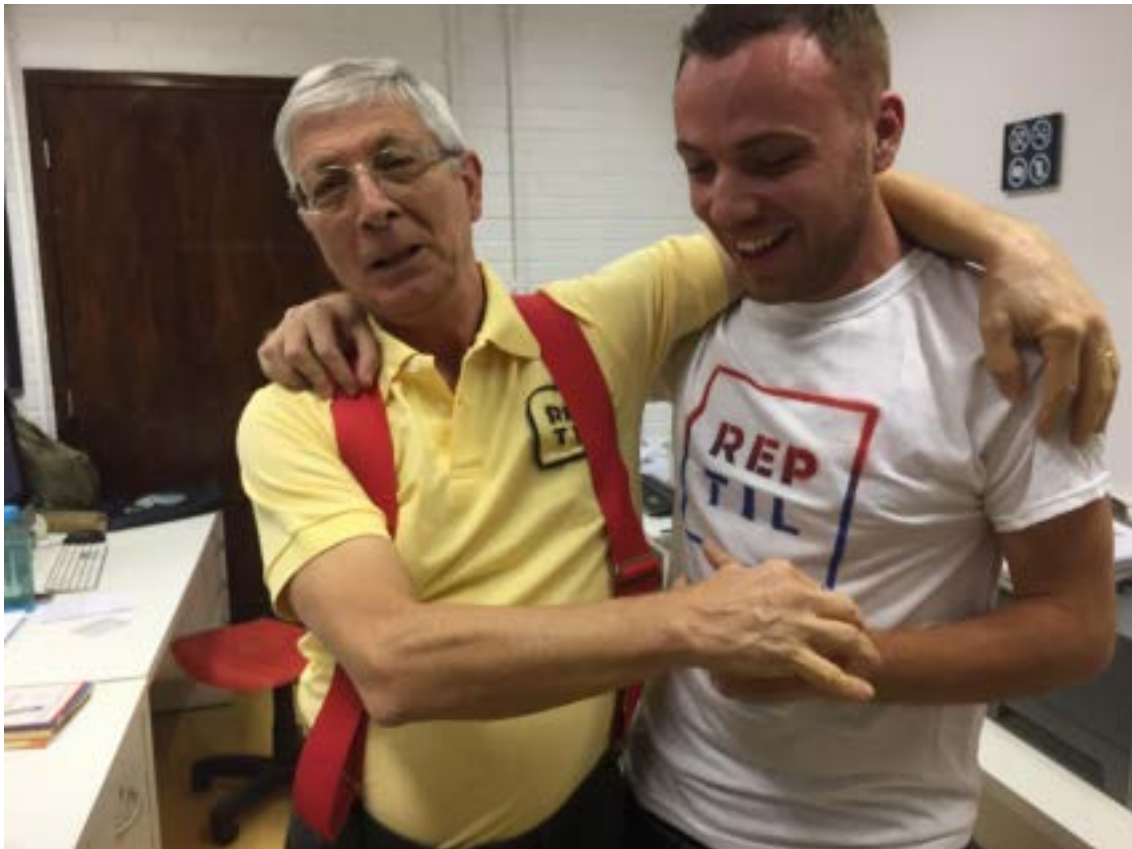
Figura 01. Um mestre e seu aprendiz.