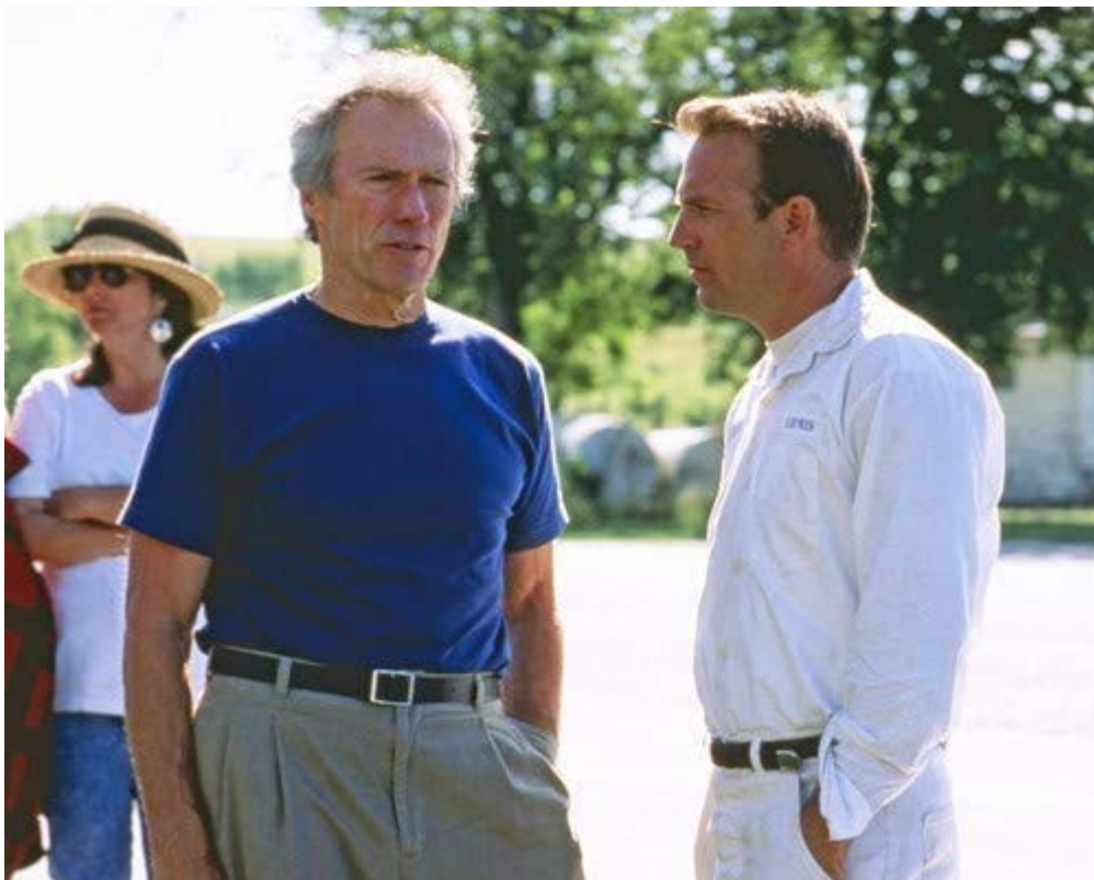
Figura 12. Clint Eastwood e Kevin Costner, 1993.