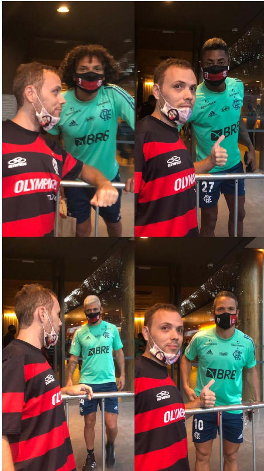
Figura 16. O autor e seus representantes.