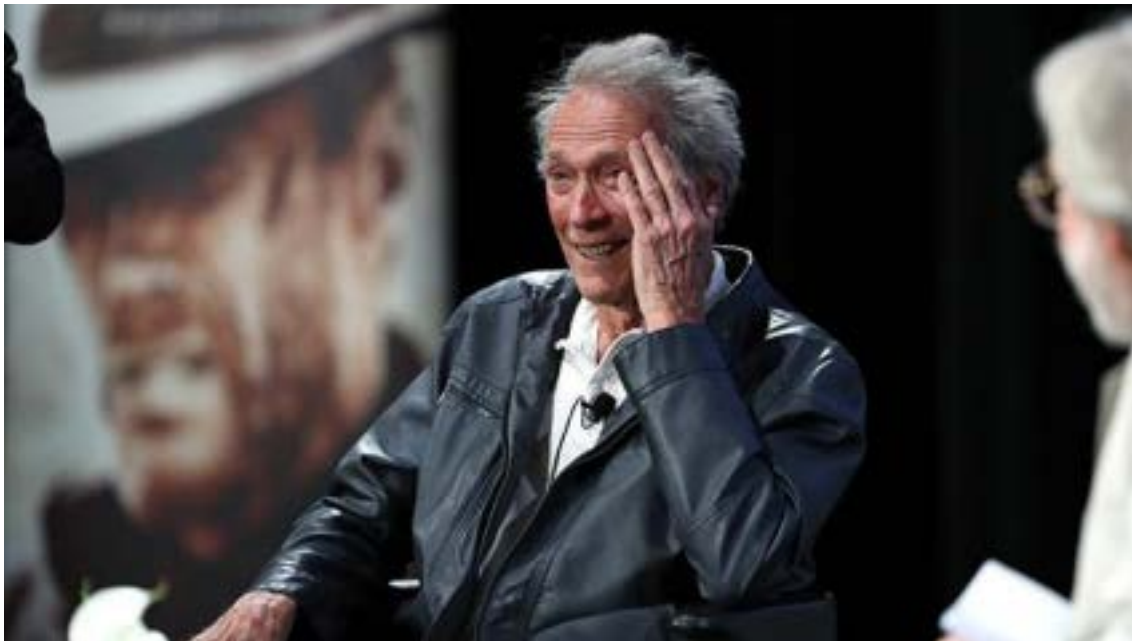
Figura 03. Clint Eastwood, 2018.