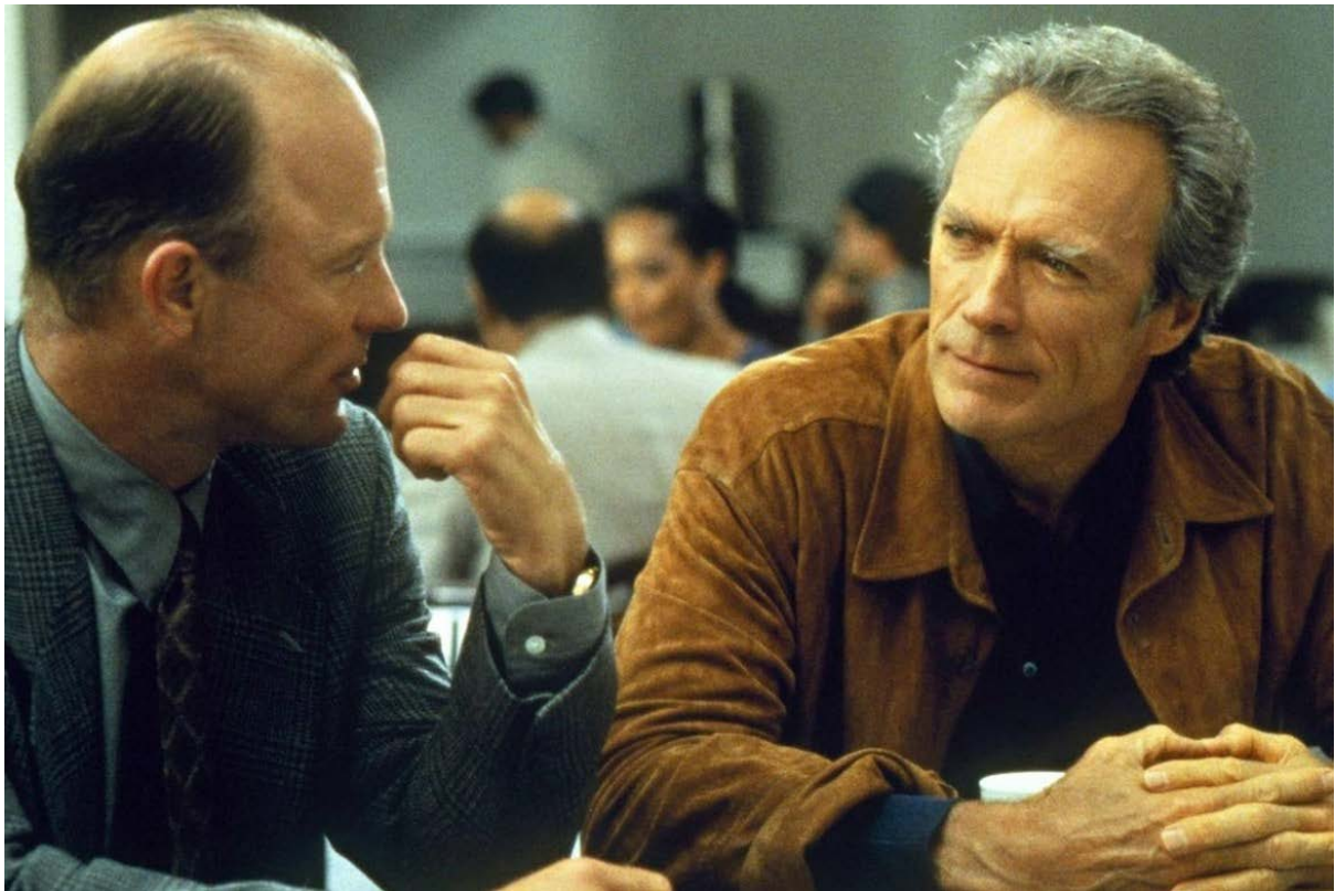
Figura 06. Clint Eastwood e Ed Helms, 1997