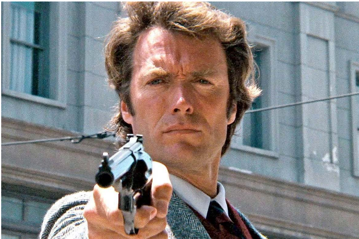
Figura 04. Clint Eastwood, 1971.