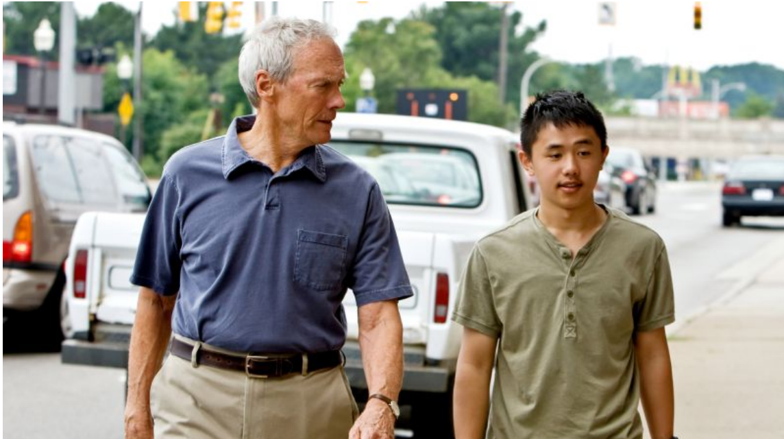
Figura 13. Walt e Thao, 2008.