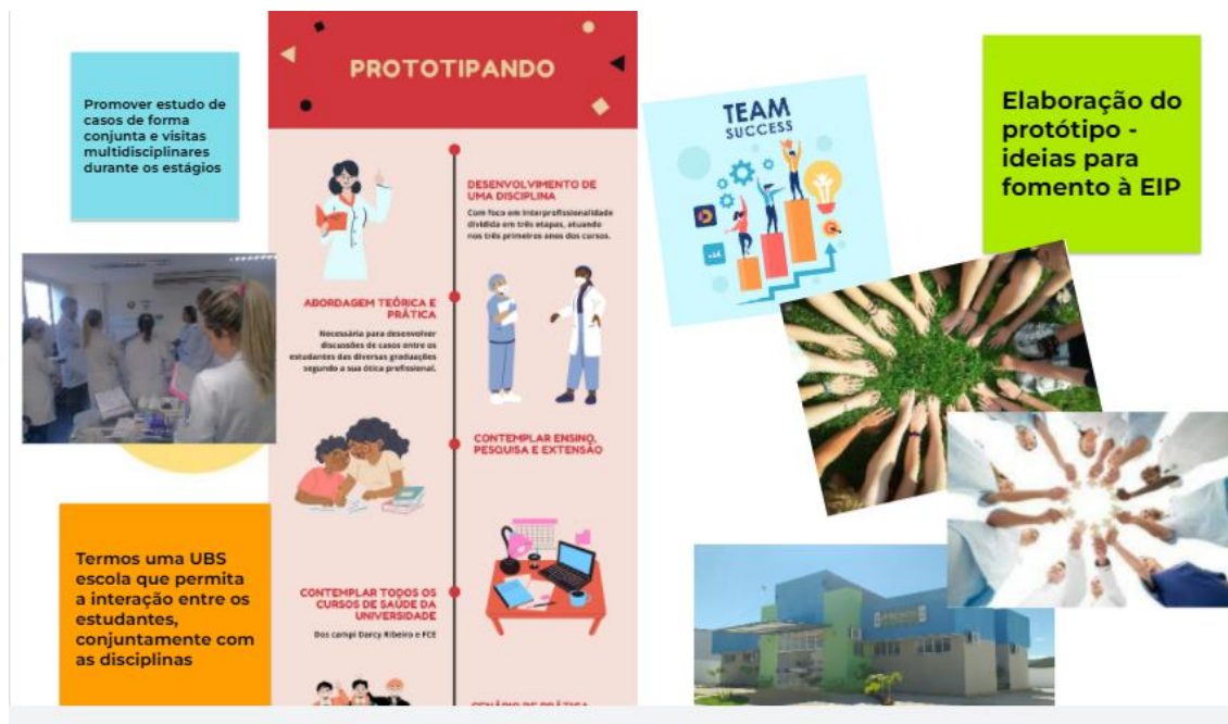
Figura 3- Protótipos desenvolvidos pelos participantes, Brasília, DF, Brasil, 2021