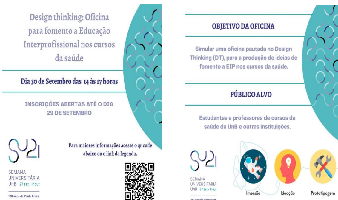
Figura 2- Convite Oficina de DT. Brasília, DF, Brasil, 2021

As duas reuniões seguintes, denominadas de oficinas teste, foram realizadas nos dias 28 e 29 de setembro de 2021. Esses encontros possibilitaram refinar os tempos para execução de cada fase e estratégias do DT, uso dos recursos digitais, sobretudo Jamboard® e chat do Youtube pois, esses seriam as ferramentas para interação entre os participantes.