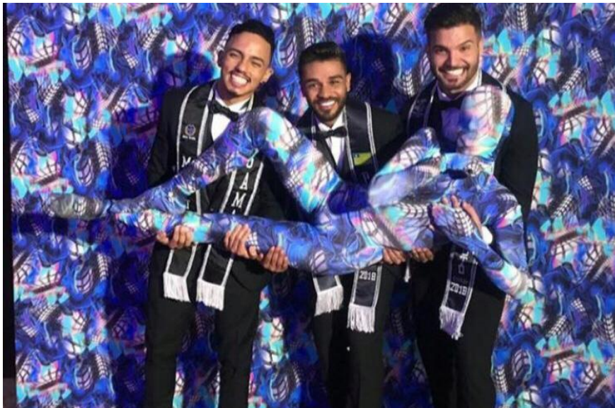
Figura 1: Festa de 15 anos, 2016.