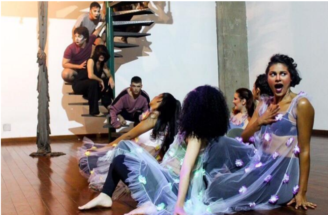
Figura 14: “Sonho de Uma Noite de Verão”, 2019. Em cena: elenco.