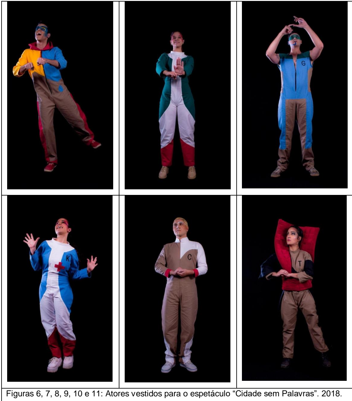
Figuras 6, 7, 8, 9, 10 e 11: Atores vestidos para o espetáculo “Cidade sem Palavras”. 2018.

Pedro já acompanhava meu trabalho nas redes sociais, e em 2018 me convidou para confeccionar os figurinos da peça “Cidade sem palavras”. Aqui, já com conhecimentos mais avançado em costura, o desafio foi com a modelagem.