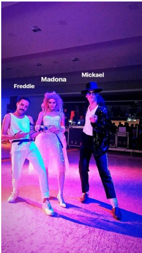
Figura 2: Festa Retrô. 2017

Mas felizmente conseguimos, cliente satisfeito com o resultado e mais pedidos para ti realizar, Figurino. A figura 2, mais alguns trabalhos para a mesma proposta.