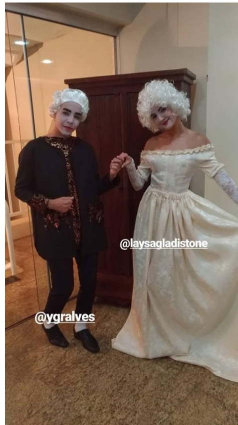
Figura 3: Festa de aniversário a fantasia, 2017

A primeira foto acima (figura 2) foi em uma festa Retrô aonde precisávamos representar Freddie Mercury, Madonna e Michael Jackson. Meu trabalho aqui foi confeccionar você como Freddie e Madonna apenas.