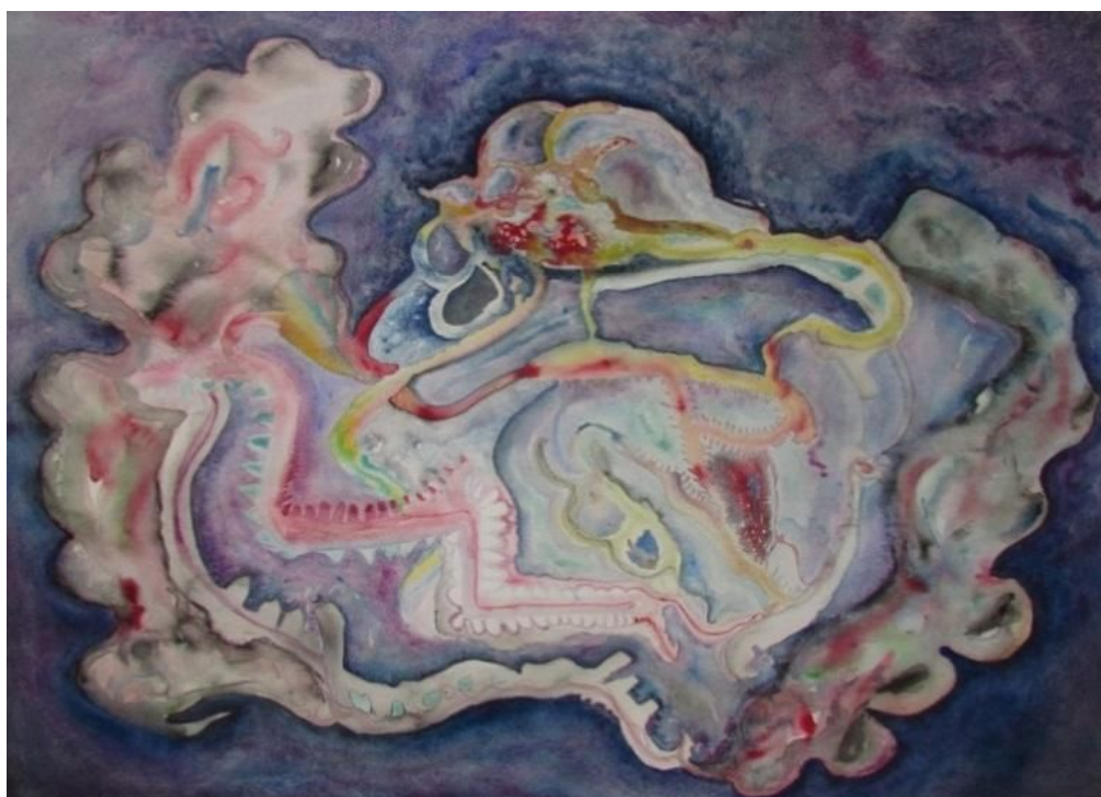
Fig.10 - Amanda Rodrigues Manchas 2 – aquarela, 2017.