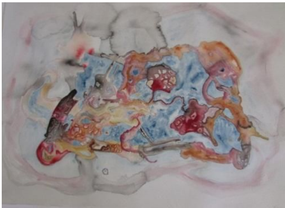
Fig.9 - Amanda Rodrigues - Manchas 1 - aquarela, 2017