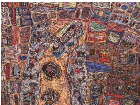
Fig. 7 Jean Dubuffet Affluence, 1961

Outro artista que aborda o acaso nos seus trabalhos é o francês Jean Dubuffet (Lichtensteian apud: Dubuffet, 2006) que relata seu interesse pelos acidentes e acasos que aconteçam nas suas pinturas. Segundo Dubuffet, muitos artistas ignoram a presença do acaso em suas obras porque buscam representar um modelo. Ele faz “um convite irônico” para que os artistas abandonem os “métodos de execução”, sugerindo que o artista vejam nas próprias manchas o que devem representar. “E você, pintor, atenção às manchas e traços, olhe suas paletas, seus trapos: a chave que tanto procura está aí.” (DUBUFFET, apud: LICHTENSTEIN, 2006, p.84).