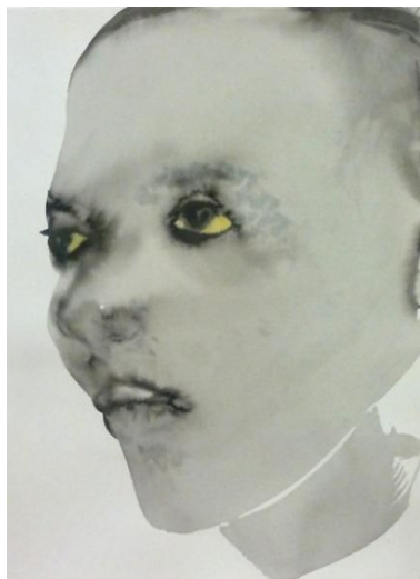
Fig. 5 Marlene Dumas, Models. 1994, inkwash, watercolor and chalk on paper

Encontrei nas aquarelas da artista sul-africana Marlene Dumas, uma referência da incorporação do acaso na imagem. Embora seu trabalho seja de natureza figurativa, podemos ver tanto o controle técnico da artista quanto a capacidade dela de interferir na imagem, de agir sobre a imagem surgem dos acontecimentos inusitados do material sobre o papel. Percebemos enfim perceber como a artista transforma manchas de água e pigmento em corpos e rostos expressivos, como a artista age sobre as manchas que surgem no suporte, como enfim, a artista trabalha o que Eco nomeia de flexibilidade do artista.