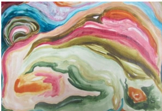
Fig. 2 Amanda Rodrigues. Experimentos – aquarela sobre papel, 2015.

Quando cursei a disciplina de Ateliê I, deixei-me levar pelas formas abstratas, pelas imagens que vinham a minha mente, período em que ampliei meus horizontes, experimentando outros materiais e técnicas nos meus trabalhos, por exemplo, a mistura de aquarela com a tinta acrílica e o uso de diferentes papéis (fig.2 e 3)