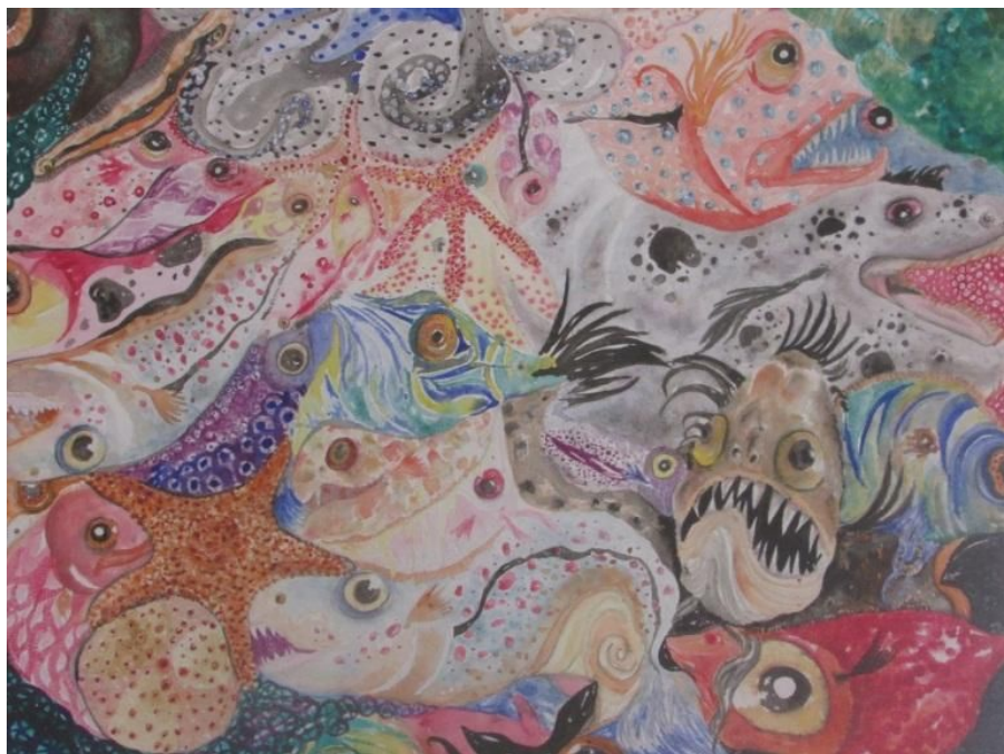
Fig.1 Amanda Rodrigues. Animais marinhos – aquarela sobre papel, 2013.

Aqueles desenhos feitos com lápis de cor que formavam um emaranhado de figuras, mais tarde passaram a ser feitos com aquarela, e os “acontecimentos impossíveis” se transformaram em olhos, peixes e frutas, feitos sem planejamento, que ocupavam todo o espaço do papel. (fig.1).