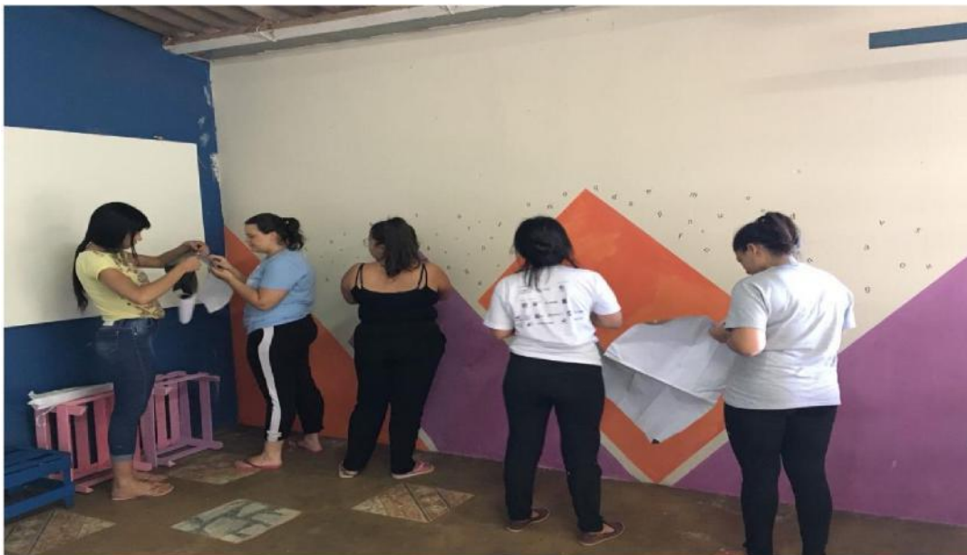
Imagem 1 – Espaço físico de desenvolvimento do LeiA